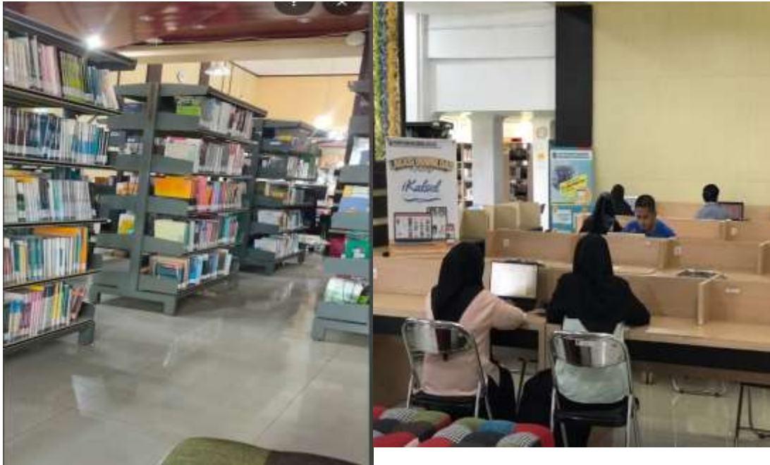
Ruang layanan umum dari usia remaja hingga dewasa