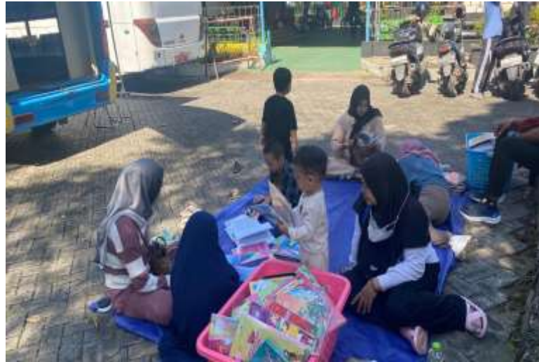
Dokumentasi perpustakaan keliling, Taman Edukasi Banua Lalulintas, Banjarmasin