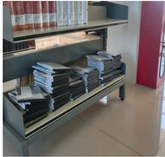
Disini juga terdapat koleksi lain dan komputer pembaca layar