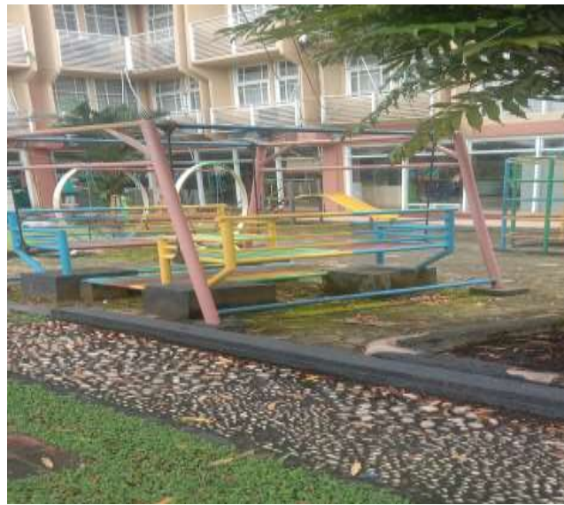
Ruang layanan khusus anak-anak dan disampingnya terdapat area bermain