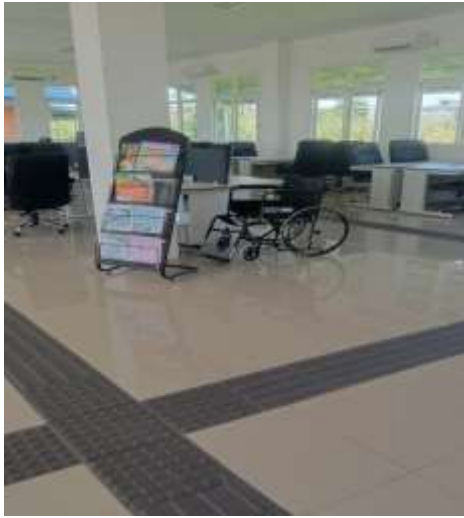
Ruang layanan disabilitas yang terdapat koleksi braille bagi difabel netra dan kursi bagi yang cacat fisik