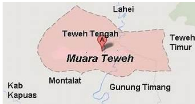
Gambar.4.3. Peta Kota Muara Teweh

Batas-batas Kabupaten Barito Utara adalah sebagai berikut: