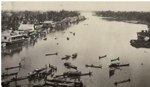
1.2. Gambar Kota Muara Teweh Pada Masa Kolonial

Pada masa kolonial, Muara Teweh menjadi salah satu titik penting dalam Perang Barito yang dipimpin oleh Pangeran Antasari dan tokoh-tokoh Dayak setempat. Perlawanan terhadap Belanda di wilayah ini terjadi sangat sengit karena letaknya yang terisolasi dan sulit dijangkau oleh pasukan kolonial. Sejarah mencatat bahwa kedalaman hutan dan kegigihan pejuang lokal menjadikan Muara Teweh sebagai basis pertahanan yang kuat bagi para gerilyawan yang menolak tunduk pada monopoli perdagangan Belanda. 5