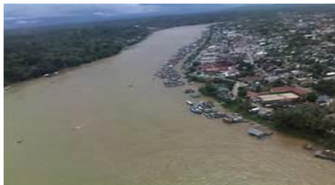
Gambar.4.4. Foto Sungai di Barito Utara