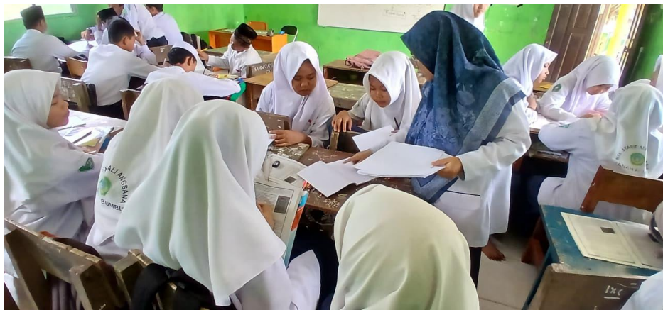
Gambar 4.3 Guru memantau secara langsung aktivitas pembuatan mind mapping

semangat dan partisipasi yang sebanding dengan kelompok yang telah selesai lebih awal. Ketika seluruh kelompok menyelesaikan pembuatan mind mappingnya, kemudian dikumpulkan kepada guru dan guru melaksanakan kegiatan evaluasi secara tertulis untuk menguji pemahaman masing-masing kelompok.