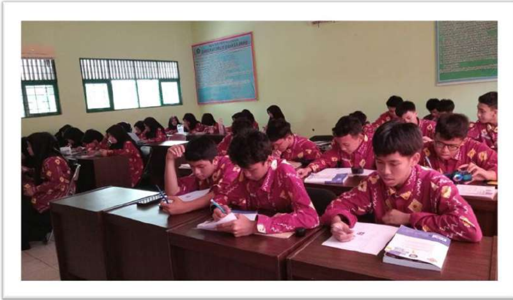
الاختبار القبلي للصف الضابط