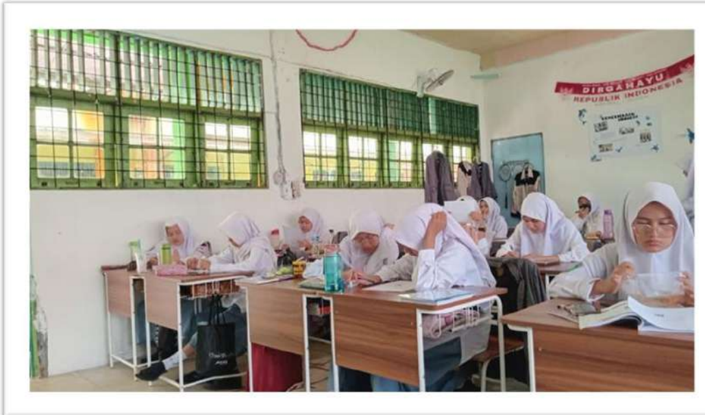
الاختبار القبلي للصف التجريبي