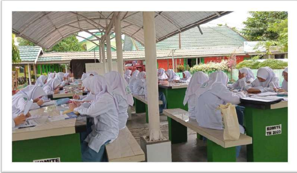
الاختبار البعدي للصف التجريبي