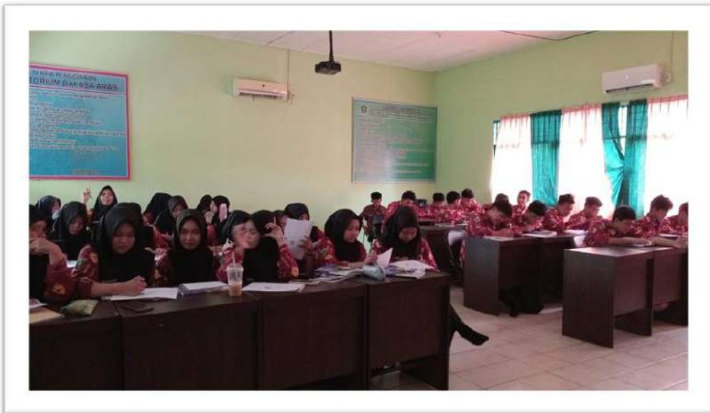
الاختبار البعدي للصف الضابط