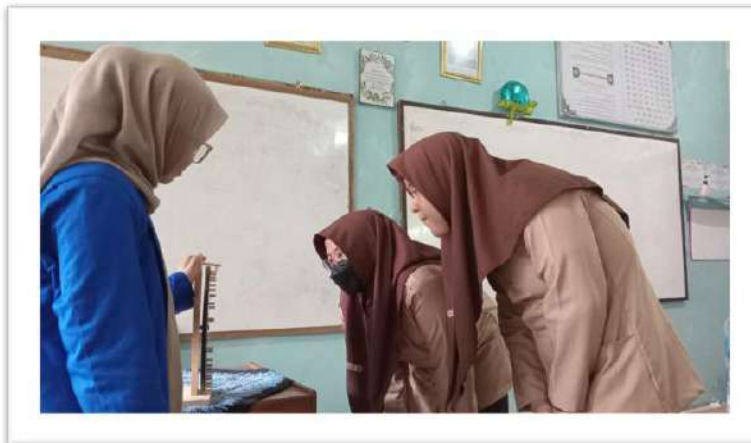
تطبيق وسيلة العجلة الدوّارة للصف التجريبي