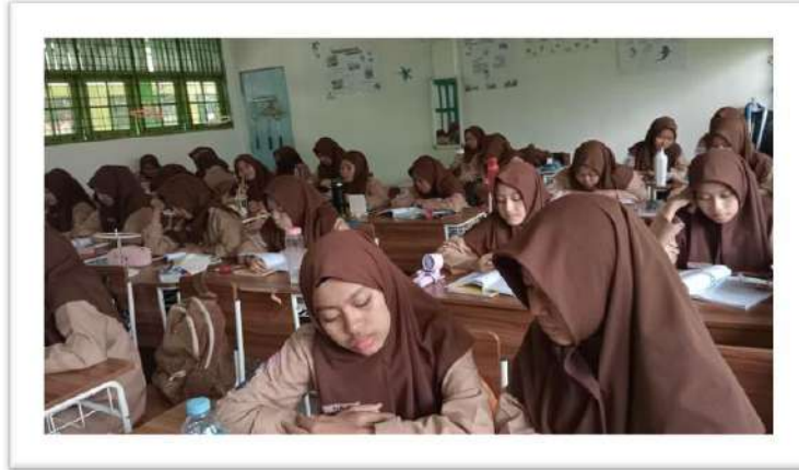
تطبيق وسيلة العجلة الدوّارة للصف التجريبي