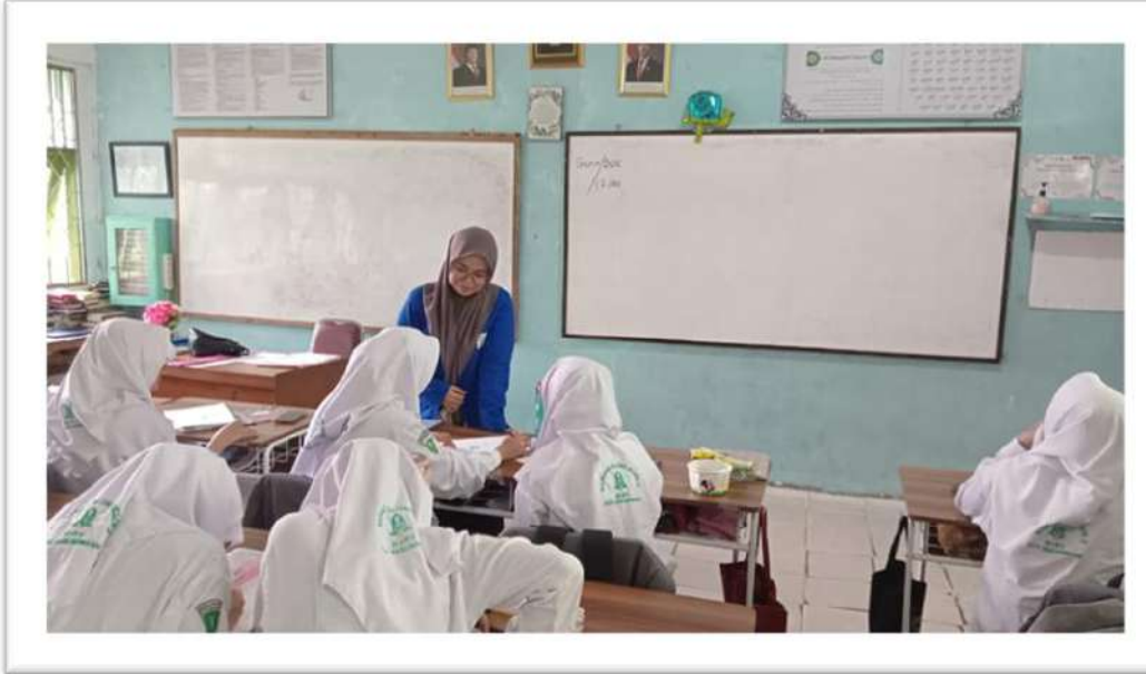
الاختبار القبلي للصف التجريبي