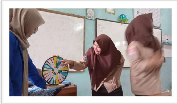
تطبيق وسيلة العجلة الدوّارة للصف التجريبي