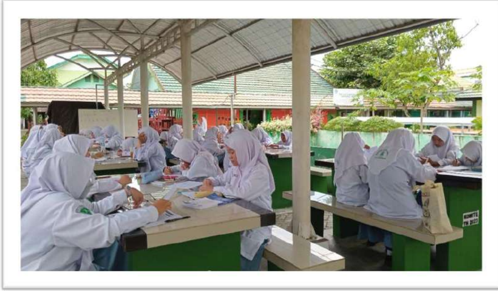
الاختبار البعدي للصف التجريبي