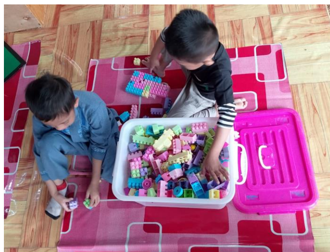
Gambar 4.3 Anak bermain Lego Balok

Lego balok merupakan alat main edukatif berupa balok-balok konstruksi yang dapat disusun, ditumpuk, dan dikombinasikan sesuai kreativitas anak. Permainan ini termasuk dalam play-based learning yang merangsang kemampuan berpikir logis, pemecahan masalah, serta keterampilan numerik dasar seperti pengelompokan dan pengenalan pola angka. 2