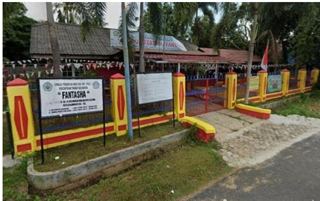
Gambar 4.1 TK Fantasha Banjarbaru