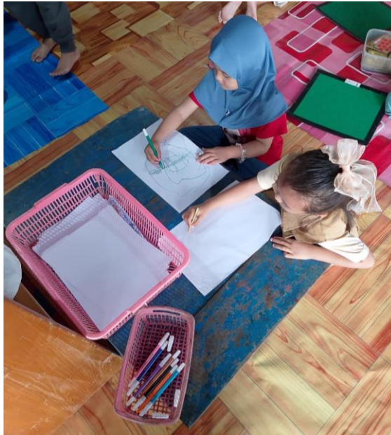
Gambar 4.5 Anak menjurnal

Jurnal digunakan dalam Program Literasi Numerasi ini untuk mendokumentasikan proses pembelajaran anak yang nantinya menjadi indikator dalam pengukuran perkembangan kognitif. Jurnal juga berfungsi sebagai sarana ekspresi dan refleksi anak terhadap pengalaman belajarnya, misalnya menggambar jumlah benda atau menuliskan angka yang dipelajari.