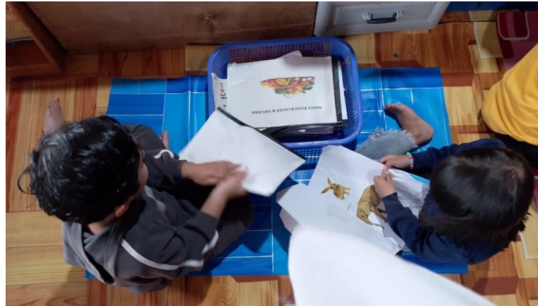
Gambar 4.7 Anak membaca buku cerita

Kegiatan membaca buku cerita dalam program literasi numerasi di TK Fantasha Banjarbaru mengintegrasikan pemahaman angka dalam konteks naratif, membantu anak mengaitkan konsep numerik dengan makna yang lebih luas. Kegiatan membaca buku cerita ini juga mendukung perkembangan kognitif anak melalui kemampuan memahami alur cerita, mengenal konsep bilangan dalam konteks sehari-hari, serta mengembangkan daya pikir dan imajinasi anak dalam Program Literasi Numerasi. Anak akan mulai membuka buku cerita sesuai dengan minat nya, bersama lawan bicara nya anak berdiskusi tentang isi dari buku cerita yang anak gunakan “Lihat disini ada 2 anak rusa dan 1 mama nya, aku juga ada ikan dan mama nya dan papa nya” (CWG1) mendengar diskusi tersebut guru mulai ikut berdiskusi dengan anak “Nak ini hewan apa ya? berwarna apa hewan ini? ada berapa ya hewan disini? ada siapa saja disini?” (CWG1) . Hal ini membuat perkembangan anak untuk memahami konsep bilangan dalam konteks cerita serta melatih daya ingat dan pemahamannya.