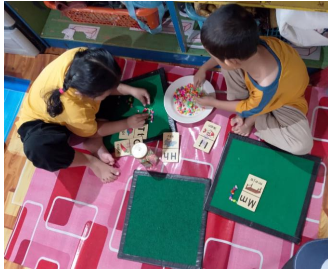
Gambar 4.9 Anak membentuk huruf dari manik-manik

Dalam pelaksanaan Literasi Numerasi pada kegiatan ini membantu anak menginternalisasi bentuk angka dan huruf secara aktif, sehingga memperkuat fondasi perkembangan kognitif mereka, seperti aktivitas bermain sensorimotor yang melibatkan bahan alam sebagai media pembelajaran. Anak menyusun manik-manik dengan mengikuti pola huruf atau angka yang telah ditentukan, ketika anak sudah mulai terlihat banyak menggunakan manik-manik dan berbentuk sesuatu, guru mulai mengajak anak berdiskusi “ Manik-manik nya di bentuk huruf apa nak? di bentuk angka berapa ini nak? ” (CWG1). Kegiatan ini mendukung perkembangan kognitif anak melalui pengenalan bentuk huruf dan angka, peningkatan konsentrasi, serta koordinasi mata dan tangan serta memahami konsep simbol secara konkret sebelum ke tahap abstrak.