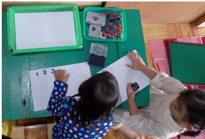
Gambar 4.6 Anak bermain Cap Angka dan Huruf

Cap angka dan huruf adalah alat pembelajaran konkret yang memungkinkan anak mencetak simbol angka dan huruf pada media kertas. Aktivitas ini memperkuat pengenalan simbol, koordinasi motorik halus, dan membangun hubungan antara bentuk simbol dan maknanya secara visual serta kinestetik. Penelitian terkait menunjukkan bahwa alat permainan yang memfasilitasi keterlibatan sensorik (seperti stempel/cap) dapat meningkatkan daya ingat visual dan keterampilan simbolik pada anak usia dini. 5