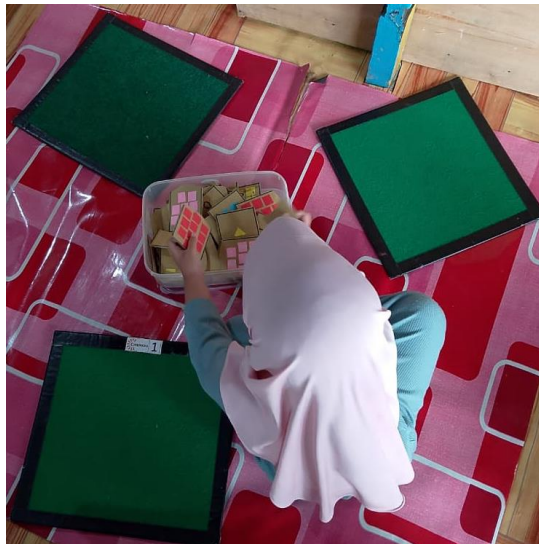
Gambar 4.4 Anak bermain Puzzle Angka

Puzzle angka adalah alat permainan edukatif yang terdiri dari bagian-bagian angka yang harus disusun untuk membentuk urutan atau pola tertentu. Puzzle ini mendorong anak mengembangkan fokus, konsentrasi, kemampuan logika, serta keterampilan mengidentifikasi dan mengenal simbol angka. 3