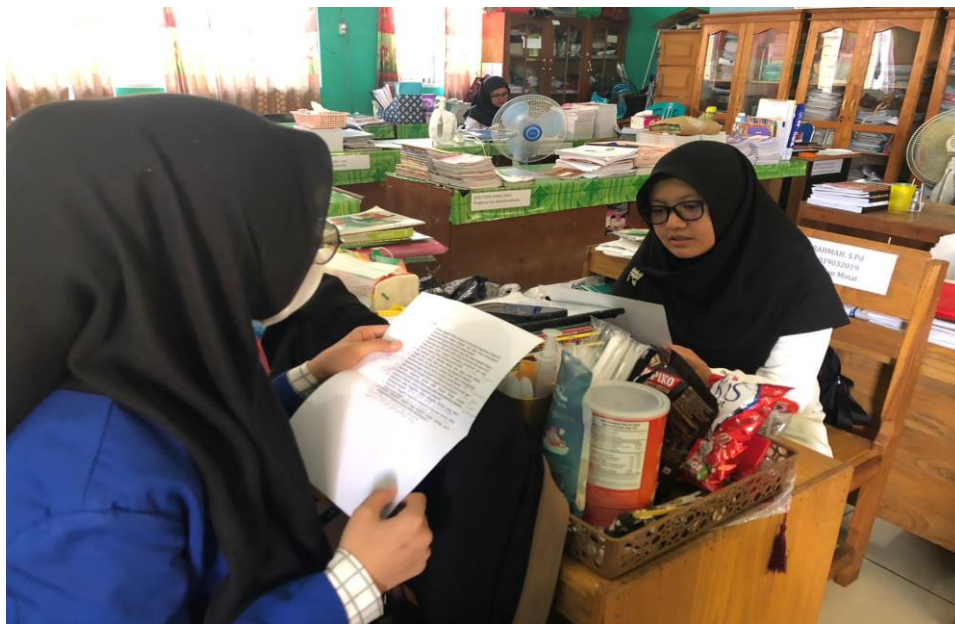
Wawancara dengan Ibu Guru Wali Kelas Kasyifiatur Rahmah