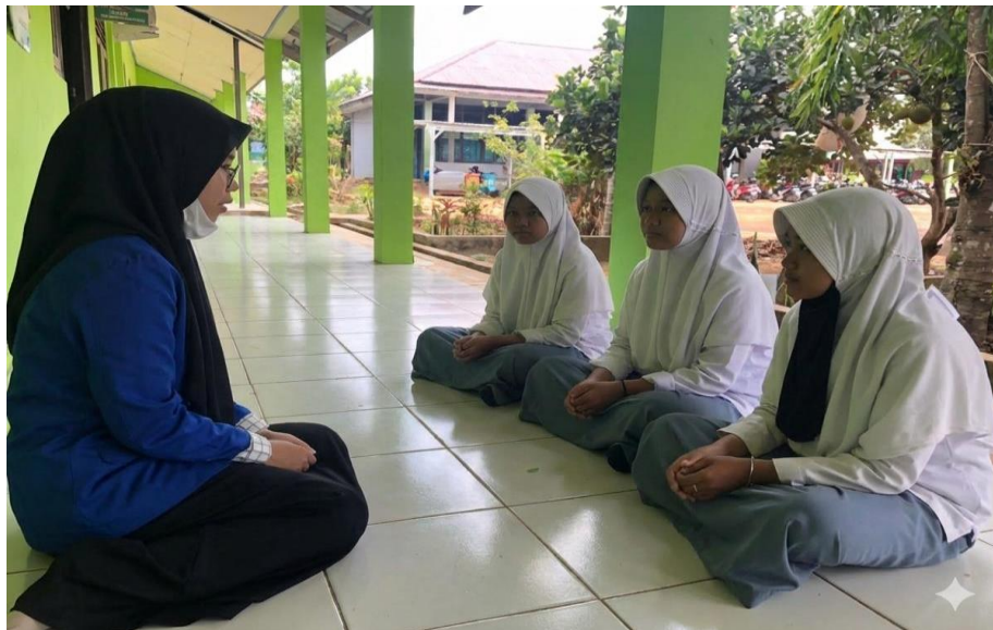
Wawancara dengan peserta didik