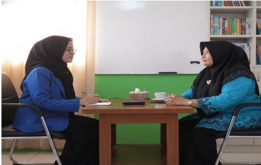
Wawancara dengan kepala MAN Tanah Laut