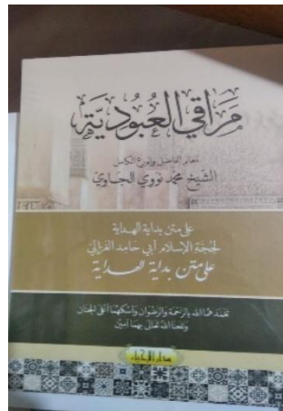
Gambar 4. 3 Kitab Maraqi al-‘Ubudiyah Syarah Kitab Bidayatul Hidayah 80

Diantara sekian banyak doa dari bangun tidur hingga tidur lagi, kita jadikan sebagai amalan, doa itu termasuk ibadah yang kada berasa sebagai tabungan untuk di akhirat dan pasti dikabul cuma caranya aja yang berbeda-beda yaitu, pertama dikabulkan sesuai keinginan kita, kedua digantikan dengan keselamatan jiwa, ketiga ditabung untuk di akhirat, keempat digantikan dengan yang lebih baik, kelima dikabul tapi dilawaskan (ditunda) dulu, nah ini yang padahal sering disampaikan kepada santriwati 79