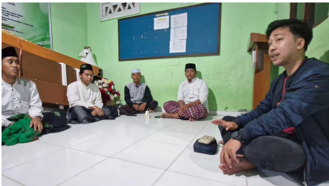
Wawancara Pengurus Osdiah