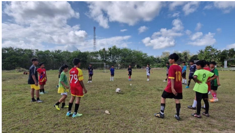
Eskul Sepak Bola