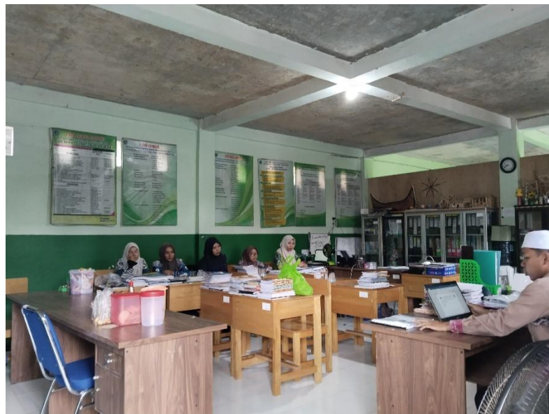
Rapat ajaran baru