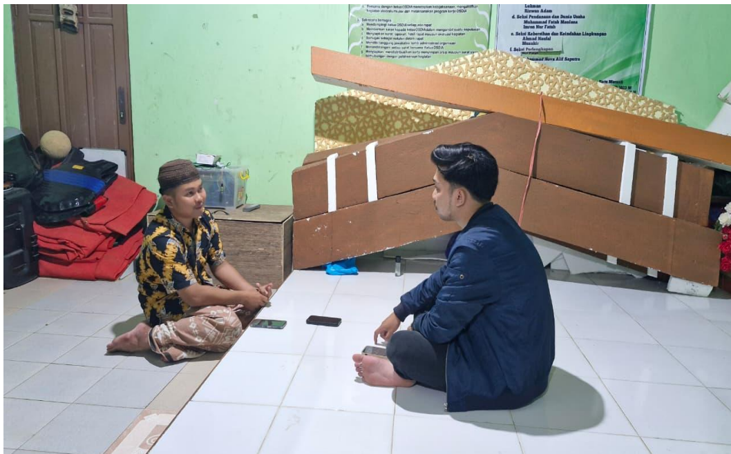
Wawancara Ketua Osdiah