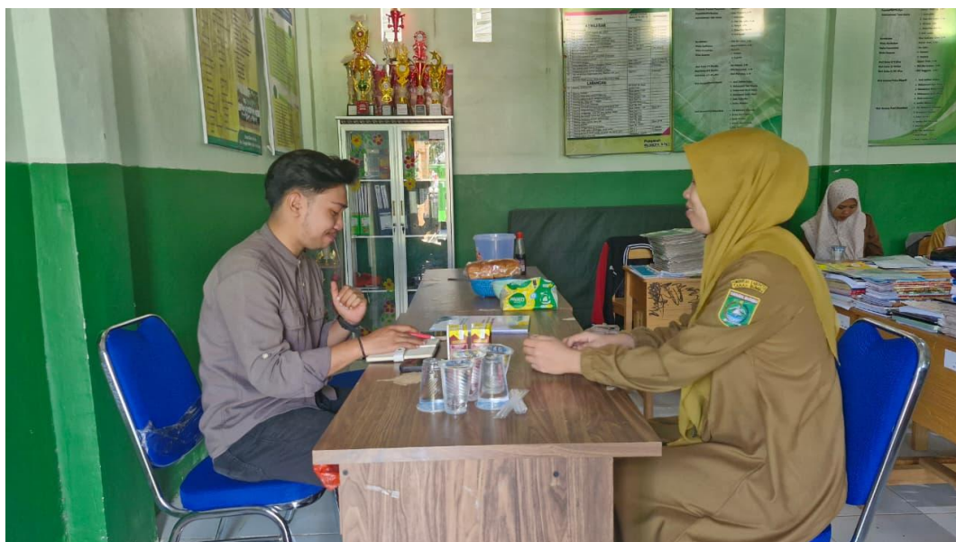
Wawancara Guru 1