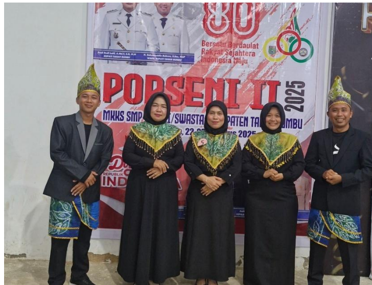
Porseni Kepsek se-Tanah Laut