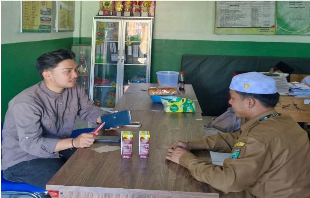
Wawancara kepala sekolah