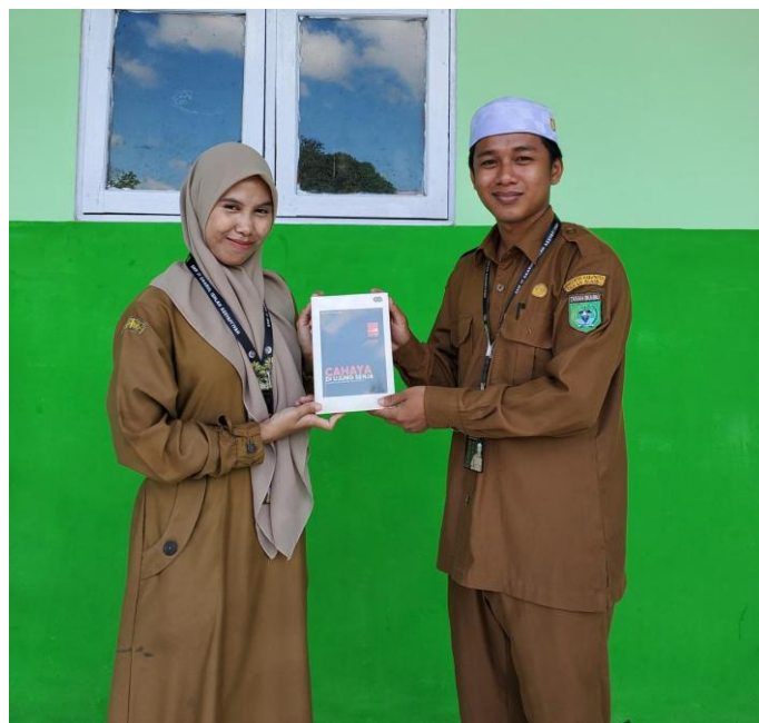
Apresiasi dari kepala sekolah terbit buku