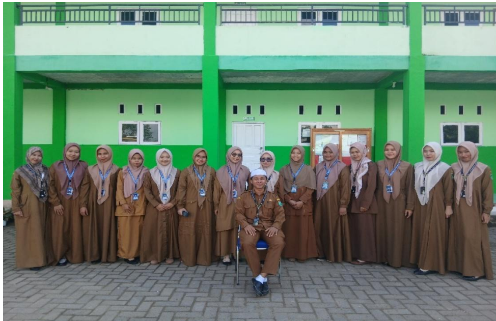
Foto Kepsek dengan Dewan Guru