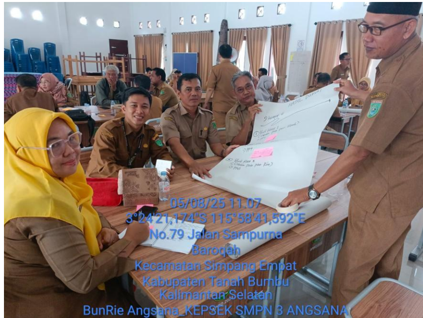
Pelatihan Kepala Sekolah