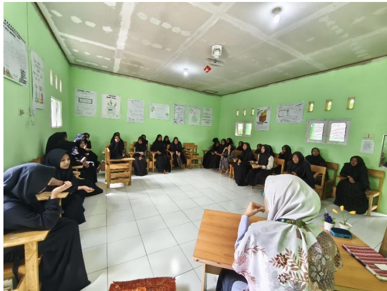
Kegiatan wali kelas bersama siswa