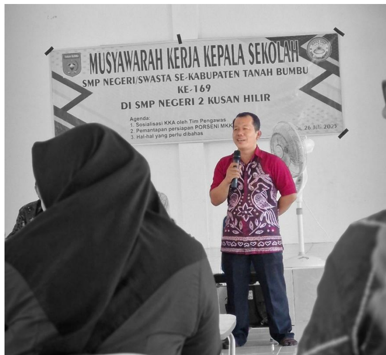
Musyawarah Kerja Kepala Sekolah