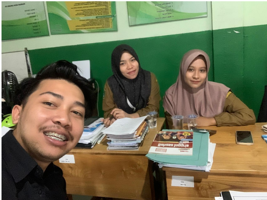
Wawancara Guru 3