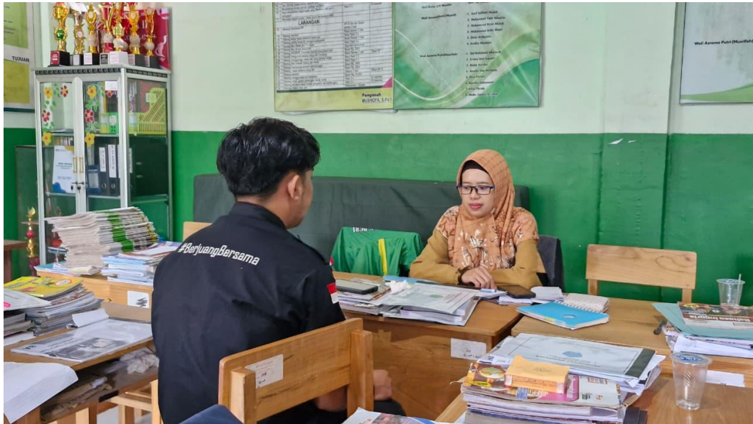
Wawancara Guru 2