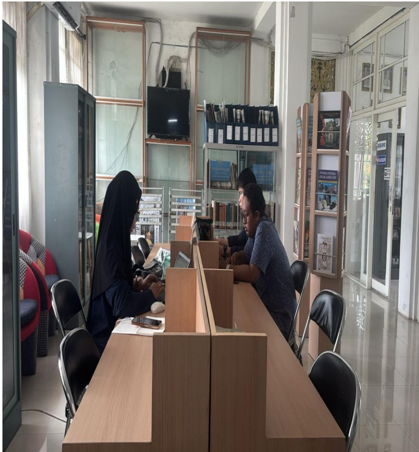
Foto pemustaka membaca di ruang referensi