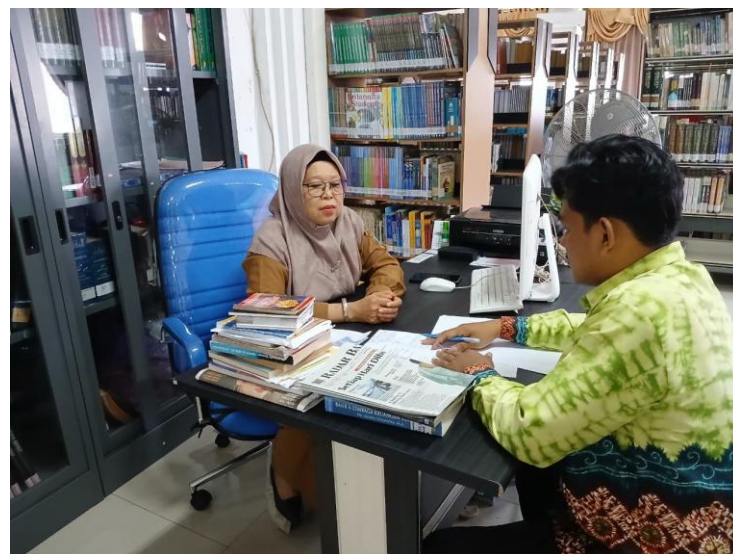
Proses wawancara dengan pustakawan Dinas Perpustakaan dan Kearsipan Daerah Prov. Kalimantan Selatan