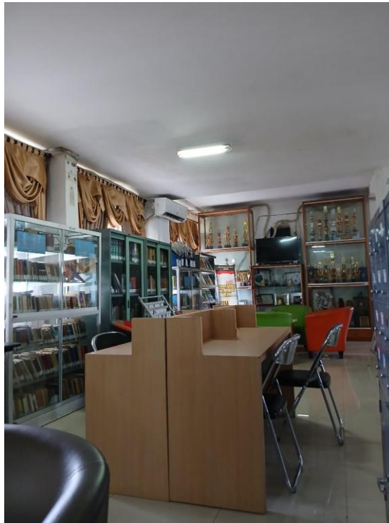
Tempat Membaca Referensi