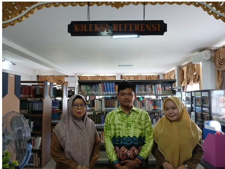
Foto Bersama Pustakawan Dinas Perpustakaan dan Kearsipan Daerah Prov. Kalimantan Selatan