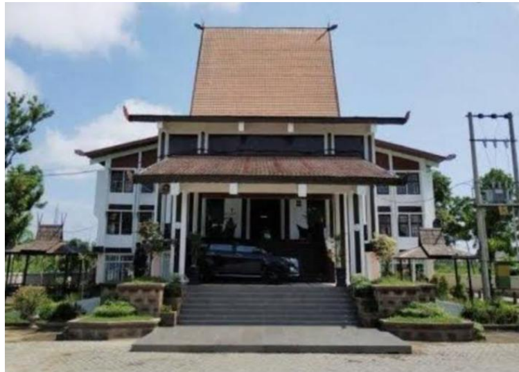
Dinas Perpustakaan dan Kearsipan Daerah Prov. Kalimantan Selatan