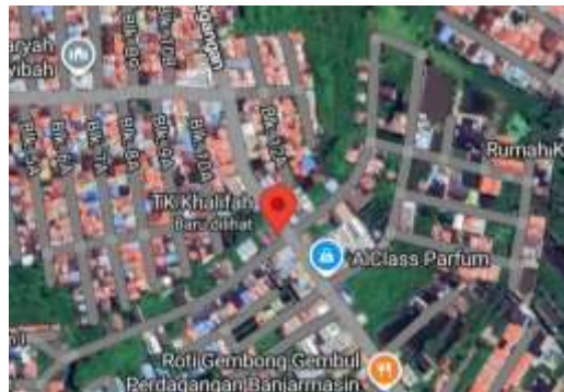
Gambar 3.1 Peta Lokasi Penelitian

Lokasi ini dipilih karena adanya program kewirausahaan yang unik, khususnya dalam bentuk kegiatan outing class . Ini menjadi alasan utama karena program semacam itu jarang ditemukan di PAUD lainnya. Adapun peta lokasi penelitian ini terlihat pada gambar 3.1 dibawah ini adalah sebagai berikut: