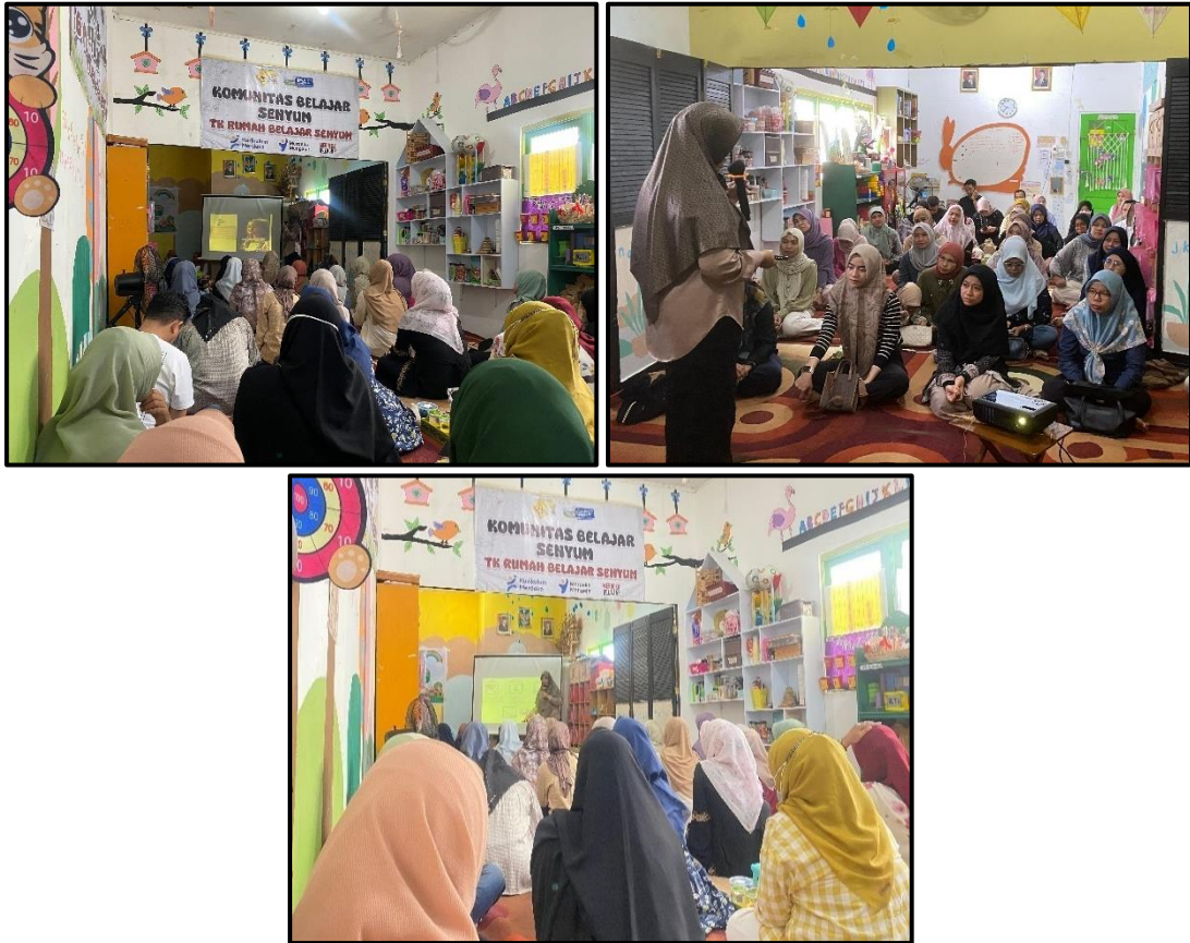
Gambar 4.8, Pelaksanaan Parenting

Berdasarkan dokumentasi pada gambar di atas, kegiatan parenting di TK Rumah Belajar Senyum tampak diikuti oleh para orang tua dengan penuh antusias dan seorang pemateri sedang menyampaikan materi dengan menggunakan media presentasi sederhana yang ditampilkan melalui proyektor. Para orang tua duduk bersama di ruang kelas, mendengarkan penjelasan sekaligus mencatat hal-hal penting yang berkaitan dengan pola asuh dan strategi mendampingi anak di rumah. Suasana ini memperlihatkan bahwa sekolah berupaya menciptakan ruang