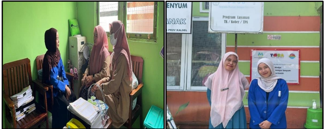
Gambar 4.4 Wawancara dengan Kepala Sekolah

Berdasarkan hasil wawancara dengan salah satu guru. pada hari Selasa, 17 Juni 2025, diperoleh informasi bahwa keterlibatan orang tua paling nampak dalam kegiatan parent teaching . Guru tersebut menjelaskan: