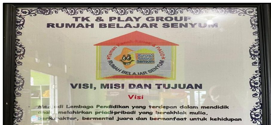
Gambar 4.2 Visi Sekolah PAUD Senyum

Visi PAUD Senyum : Menjadi Lembaga yang terdepan dalam mendidik anak, melahirkan pribadi yang berakhlak mulia, berkarakter, bermental juara dan bermanfaat untuk kehidupan.