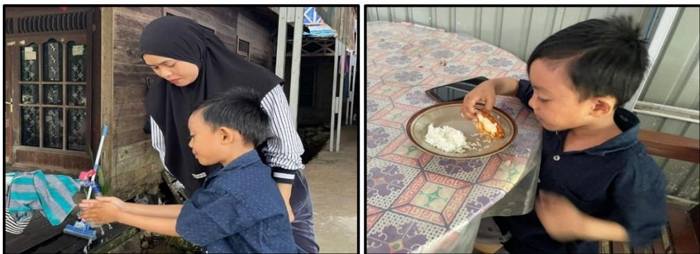
Gambar 4.9, Pelaksanaan Pembelajaran di Rumah

pemantauan ketat tanpa dukungan emosional dapat menimbulkan resistensi pada anak. Sebaliknya, ketika keterlibatan orang tua diwujudkan melalui harapan positif, komunikasi yang suportif, dan strategi belajar yang tepat, dampaknya menjadi lebih signifikan. Selain itu, faktor konteks social-ekonomi keluarga juga menentukan efektivitas pembelajaran di rumah. Keluarga dengan keterbatasan waktu, fasilitas, atau latar belakang pendidikan sering kali menghadapi hambatan dalam mendukung anak secara optimal. Oleh karena itu, program parenting yang disediakan sekolah berfungsi sebagai jembatan penting untuk mengatasi keterbatasan tersebut. Melalui pembekalan, orang tua dapat meningkatkan kapasitasnya dalam mendampingi anak di rumah, sehingga kegiatan pembelajaran di rumah tidak hanya bersifat rutin, tetapi juga berkualitas. 59 Berikut disajikan gambar pelaksanaan Pembelajaran di Rumah: