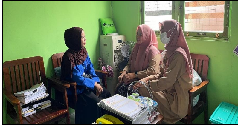
Gambar 4.5 Wawancara dengan Guru di Sekolah

Sementara itu, dari pihak orang tua, terdapat beberapa pandangan berbeda sesuai dengan latar belakang pekerjaan masing-masing: