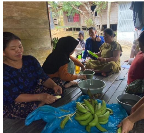
Gambar 4. 5 Pembuatan Keripik Pisang