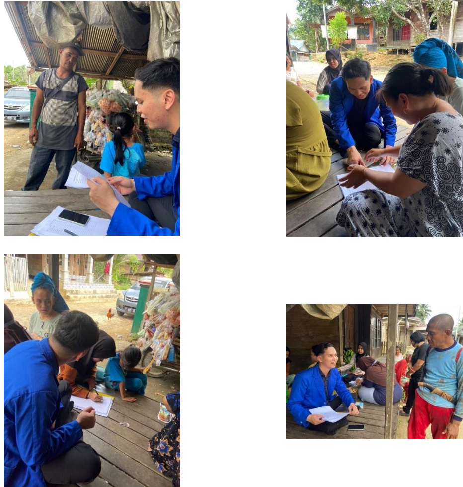
Gambar 4. 3 Wawancara Kepada Petani Pisang dan Tokoh Masyarakat