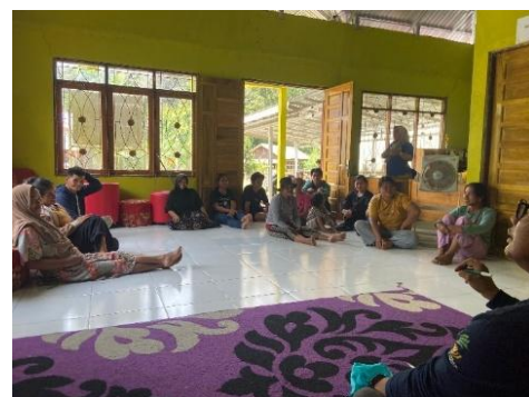
Gambar 4. 9 Rencana keberlanjutan Bersama Aparat dan Petani Pisang di Desa Hinas kanan