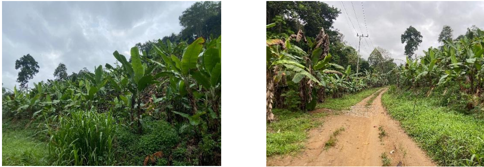
Gambar 4. 1 Kebun Pisang di Desa Hinas Kanan