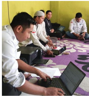
Gambar 4. 2 Diskusi Mahasiswa Dengan Aparat Desa dan Tokoh Masyarakat