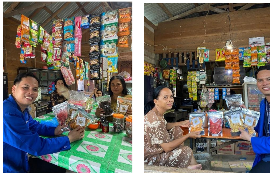
Gambar 4. 7 Pemasaran dan Distribusi Awal Melalui Warung