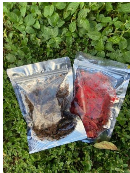
Gambar 4. 6 Produk Keripik Pisang Hinas Kanan