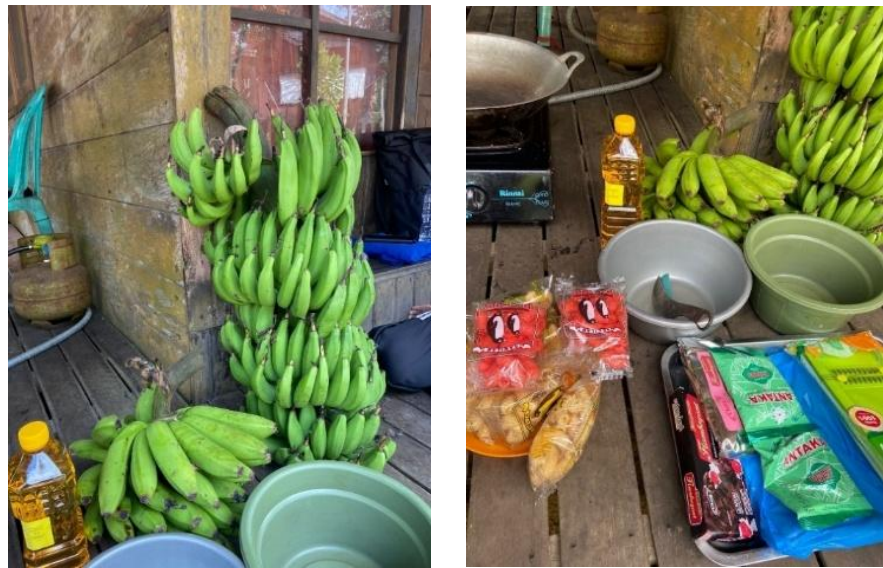
Gambar 4. 4 Alat dan Bahan Pelatihan