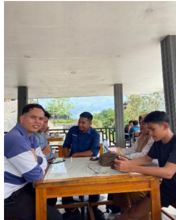
Gambar 4. 8 Pemasaran dan Distribusi Awal melalui Online (Media WhatsApp, TikTok, Instagram)

Tahap ketiga menerapkan teori strategi pemasaran produk lokal dan pemasaran Islami. Berdasarkan (Septiani & others, 2021) dan (Widianingsih & Hartono, 2022), pemasaran produk desa harus menekankan pada branding lokal, kreativitas digital, dan kejujuran dalam promosi. Dalam konteks kegiatan ini, peserta dilatih untuk memasarkan produk secara offline (melalui warung dan pasar lokal) serta online (melalui WhatsApp, TikTok, dan Instagram).