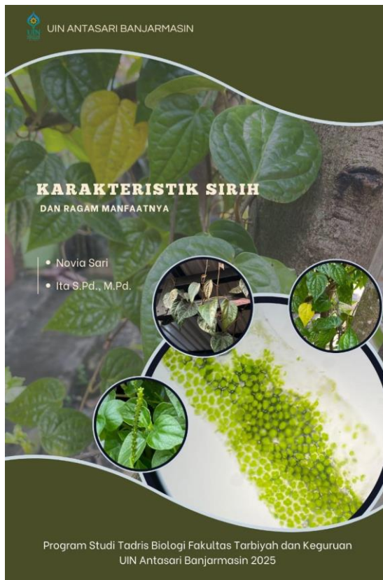
Gambar 3.1. Desain Cover BIP