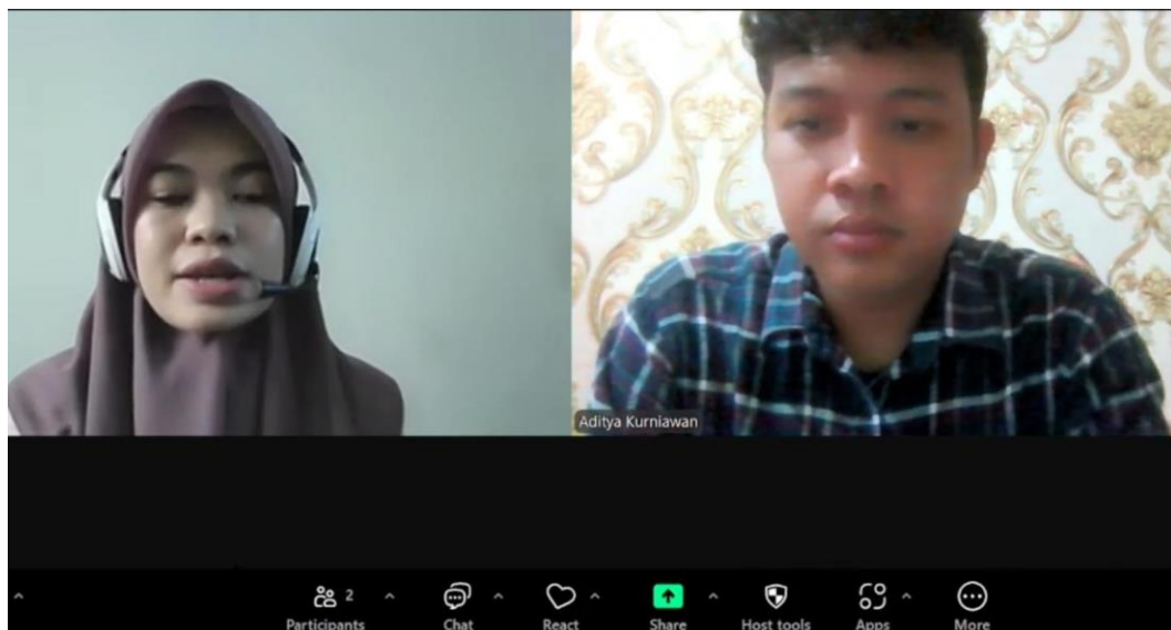
Gambar 7 Wawancara Dengan Pustakawan