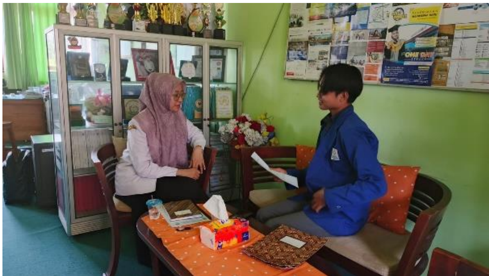
Wawancara dengan Guru Bimbingan dan Konseling