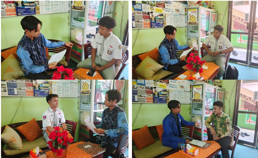
Wawancara dengan Siswa