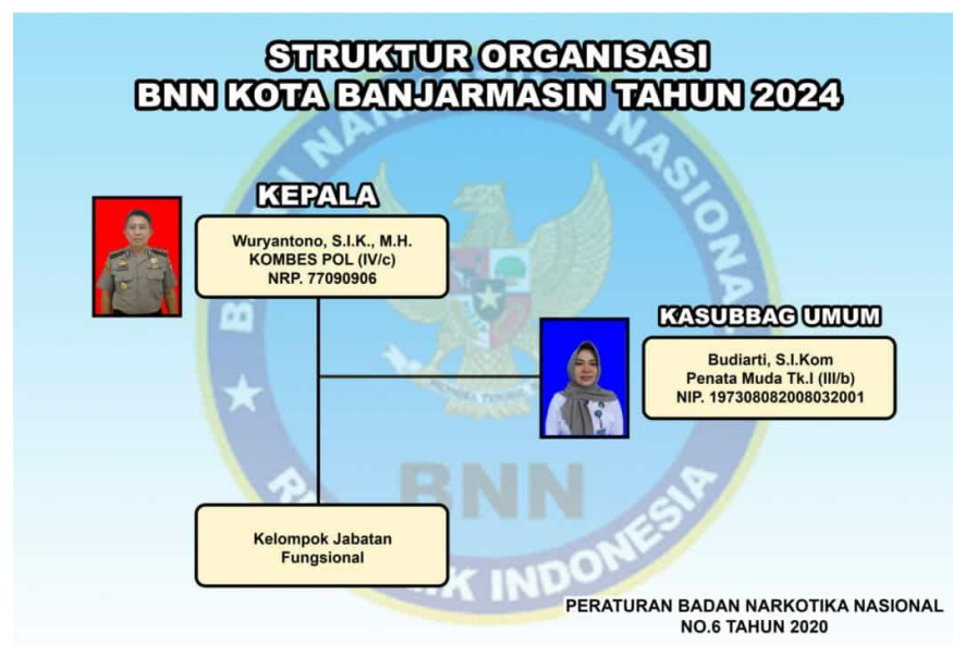
Gambar 4.3 Struktur Organisasi BNN Kota Banjarmasin