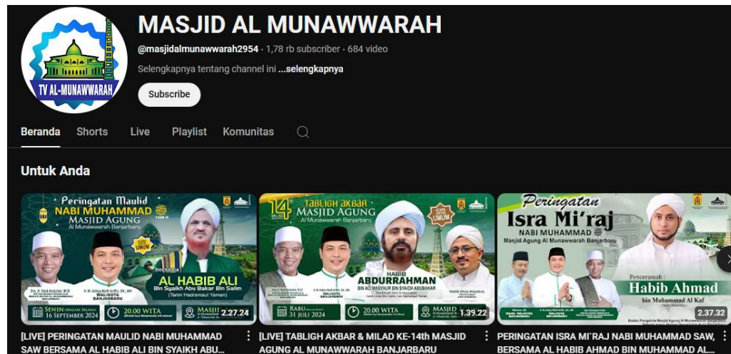
Gambar 4.5 Media Sosial Youtube Masjid Agung Al-Munawwarah Kota Banjarbaru