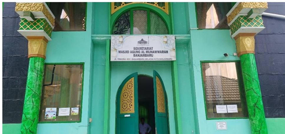
Gambar 4.3 Kantor Sekretariat Masjid Agung Al-Munawwarah Banjarbaru