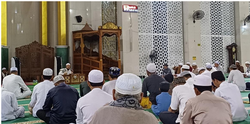
Gambar 4.4 Ceramah Agama Malam Senin di Masjid Agung Al-Munawwarah Kota Banjarbaru