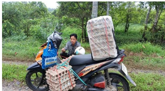
Hasil Panen di Antar ke Pengepul

Peternak menghadapi berbagai kendala seperti fluktuasi harga telur yang tidak menentu sehingga mempengaruhi stabilitas usaha. Kondisi ini menunjukkan adanya tantangan baik dalam aspek pendapatan maupun pemasaran.