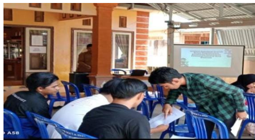
Balai Desa Masiraan

Usaha ternak itik menjadi sumber pendapatan yang cukup penting bagi keluarga, meskipun biaya operasional seperti pakan dan perawatan kandang cukup tinggi. Usaha ini tetap memberikan kontribusi ekonomi yang stabil sehingga menjadi penopang utama pendapatan rumah tangga.