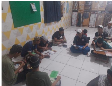
Gambar 4 6 Diskusi Pembelajaran

Hasil observasi menunjukkan bahwa setelah mengikuti kegiatan literasi digital, santri mulai menunjukkan sikap lebih kritis terhadap informasi yang beredar. Beberapa santri tidak lagi langsung mempercayai informasi yang diterima, melainkan terlebih dahulu bertanya atau meminta klarifikasi kepada ustaz atau pengurus FPP.