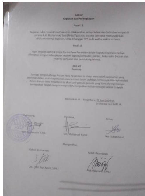
Gambar 4.2 Surat Persetujuan Program

Gambar di atas menjelaskan bahwa program FPP sudah mendapatkan tanda tangan dukungan mengenai asas, visi, dan misi dari pimpinan, pembina, ketua, kabid kesiswaan dan kabid keamanan. Meskipun begitu, FPP tetap dijalankan dengan kepengurusan yang mereka masih berstatus santri kecuali pembinanya.