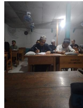
Gambar 4.5 Pembelajaran Literasi

Gambar disamping adalah situasi pembelajaran kepada santri oleh pengajar tentang dakwah literasi digital, tampak para santri itu sedang menulis di papan tulis dan memahami apa yang disampaikan oleh pengajar mengenai dakwah literasi digital.