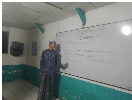
Gambar 4 4 Pembelajaran materi literasi digital oleh pengajar

“Sebagai pengajar, menurut saya tidak cukup kalau cuma pembelajaran dalam papan tulis saja, terkadang saya membuat permainan mengenai pembelajaran literasi digital ini dengan seolah-olah mereka penyebar informasi atau bisa juga mereka langsung praktik cek data secara manual supaya lebih paham dan dimengerti.”