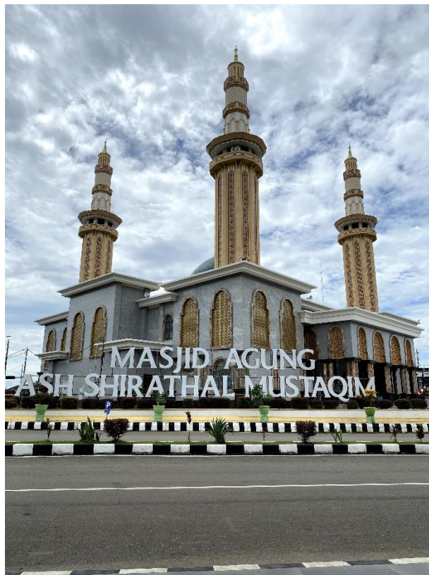
Gambar 4. 3 Gambar Masjid Agung Ash-Shirathal Mustaqim Tanjung Pada Tahun 2025