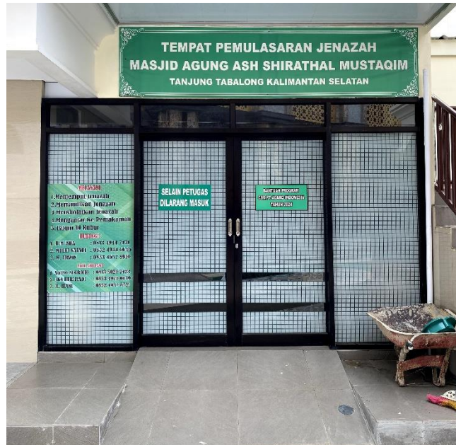
Gambar 4. 8 Gambar Tempat Pemulasaran Jenazah Masjid Agung Ash-Shirathal Mustaqim Tanjung