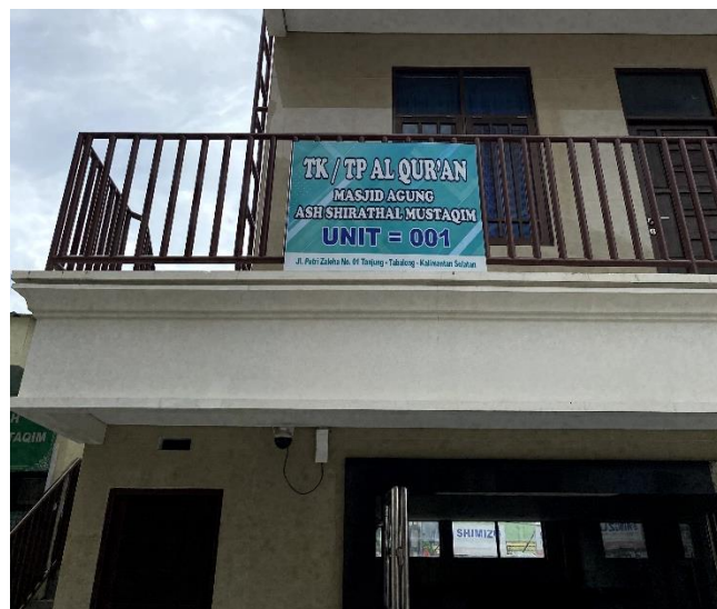
Gambar 4. 9 Gambar TK/TP Al-Qur'an Masjid Agung Ash-Shirathal Mustaqim Tanjung