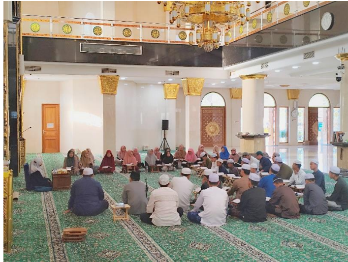
Gambar 4. 17 Gambar Kegiatan Pelatihan Tartil/Irama Lagu Masjid Agung Ash-Shirathal Mustaqim Tanjung