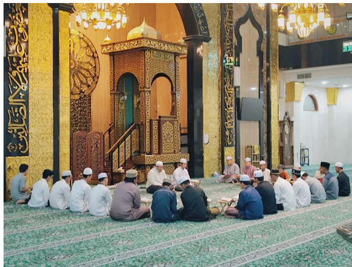
Gambar 4. 18 Gambar Pelaksanaan Khataman Tadarus Ramadhan Masjid Agung Ash-Shirathal Mustaqim Tanjung