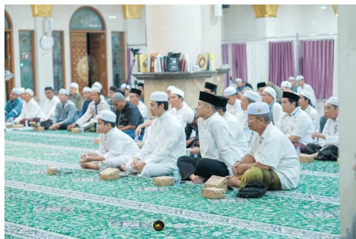
Gambar 4. 14 Gambar Pelaksanaan Peringatan Nuzulul Qur'an Masjid Agung Ash-Shirathal Mustaqim Tanjung