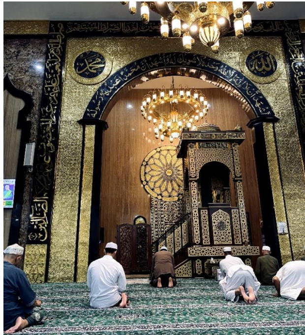
Gambar 4. 7 Gambar Bangunan Utama Masjid Agung Ash-Shirathal Mustaqim Tanjung