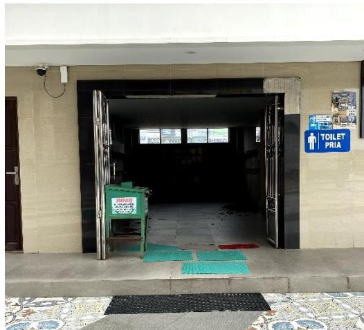
Gambar 4. 11 Gambar Toilet Pria & Wanita Masjid Agung Ash-Shirathal Mustaqim Tanjung