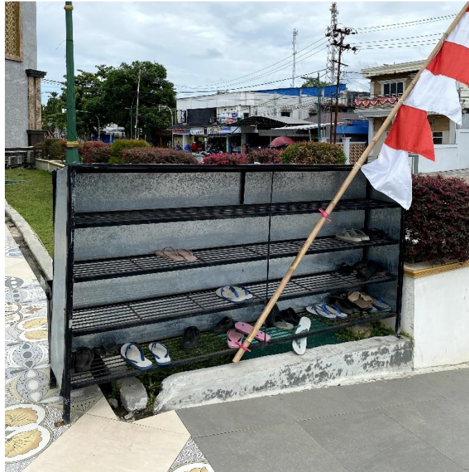
Gambar 4. 6 Gambar Tempat Alas Kaki Masjid Agung Ash-Shirathal Mustaqim Tanjung