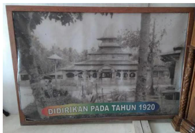
Gambar 4. 1 Gambar Masjid Agung Ash-Shirathal Mustaqim Tanjung Pada Tahun 1920