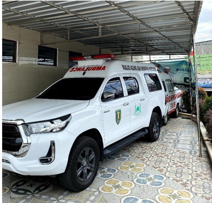
Gambar 4. 4 Gambar Sarana Mobil Ambulance Masjid Agung Ash-Shirathal Mustaqim Tanjung