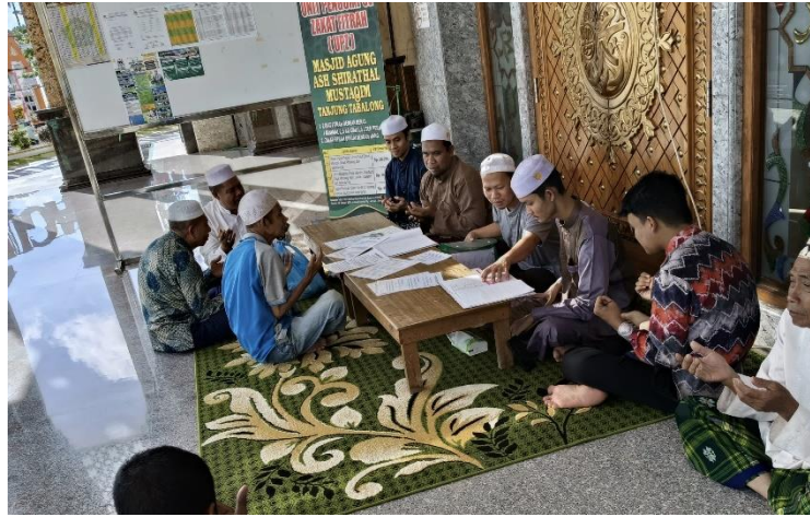
Gambar 4. 19 Gambar Pelaksanaan Penerimaan Zakat Masjid Agung Ash-Shirathal Mustaqim Tanjung