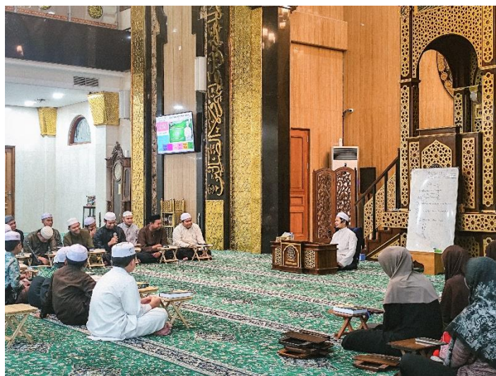
Gambar 4. 16 Gambar Kegiatan Pembelajaran Tahsin Masjid Agung Ash-Shirathal Mustaqim Tanjung