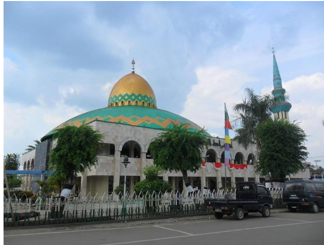
Gambar 4. 2 Gambar Masjid Agung Ash-Shirathal Mustaqim Tanjung Pada Tahun 2013