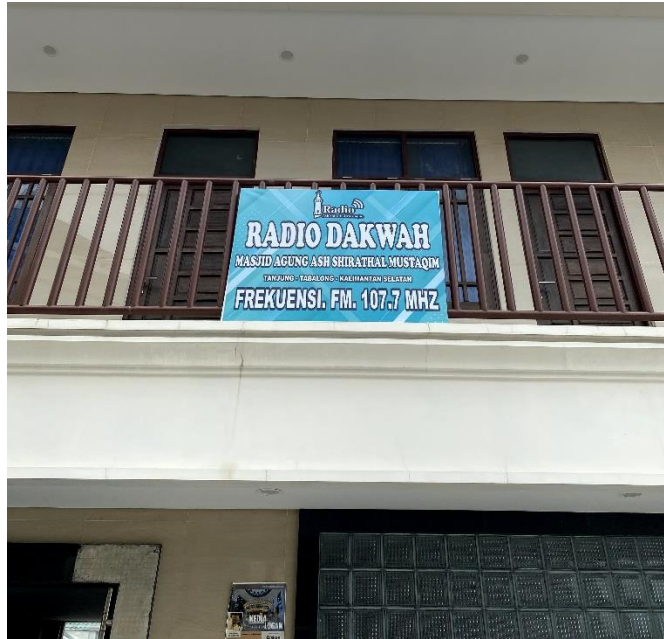
Gambar 4. 10 Gambar Tempat Radio Dakwah Masjid Agung Ash-Shirathal Mustaqim Tanjung