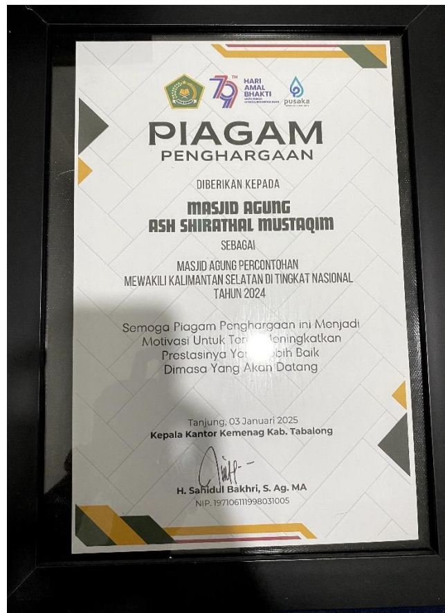
Gambar 4. 13 Gambar Piagam Penghargaan Sebagai Masjid Agung Percontohan Mewakili Kalimantan Selatan Di Tingkat Nasional Tahun 2024