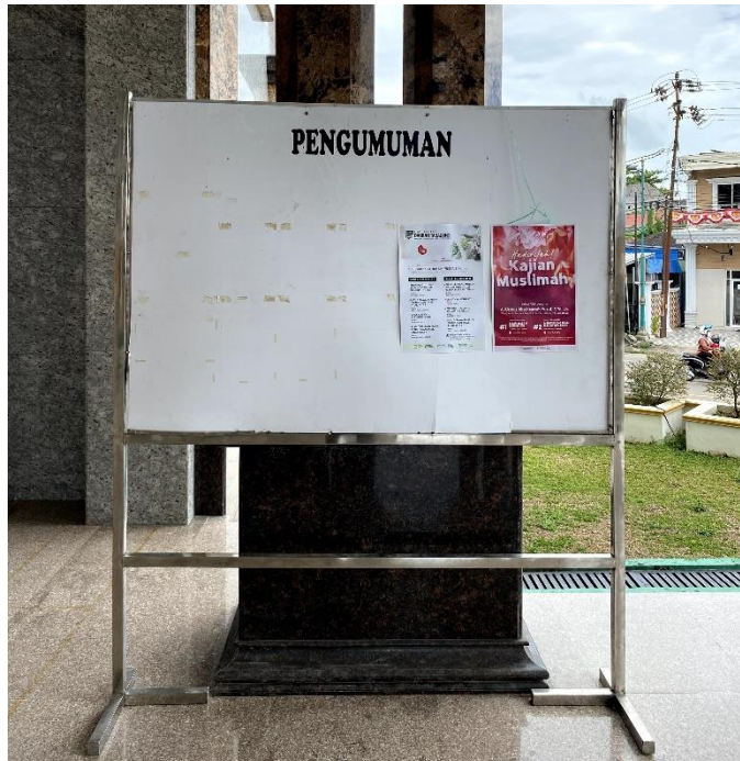
Gambar 4. 5 Gambar Papan Pengumuman Masjid Agung Ash-Shirathal Mustaqim Tanjung