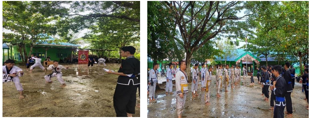
Gambar 4.7 Kegiatan Ujian Kenaikan Tingkat Santri Anggota IKSPI Pondok Pesantren Manba'ul'Ulum

Spiritualitas. UKT dilaksanakan secara sistematis dan sesuai standar IKSPI Kera Sakti, mencakup ujian fisik, teknik jurus, mental, serta pemahaman nilai-nilai organisasi. Selain sebagai momen peningkatan jenjang, UKT juga menjadi ajang memupuk rasa tanggung jawab dan kedewasaan Spiritualitas Santri.