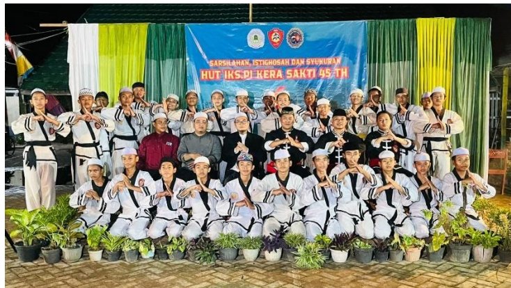
Gambar 4.12 Bentuk Seragam dan Salam Khas IKSPI Kera Sakti

Keseluruhan artefak ini tidak sekedar menjadi identitas kelompok, namun sarat akan makna Spiritualitas. Misalnya, doa bersama sebelum dan sesudah latihan yang menjadi rutinitas, merupakan cerminan bahwa setiap aktivitas silat harus dimulai dengan mengingat Allah. Ini mengandung nilai tazkiyah