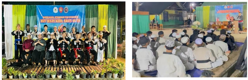
Gambar 4.8 kegiatan Memperingati Harlah IKSPI di Pondok Pesantren Manba'ul'Ulum

Pengorganisasian adalah langkah lanjutan dari proses perencanaan, dimana pembina mengatur dan menempatkan sumber daya manusia yang tersedia sesuai dengan rancangan yang telah ditetapkan sebelumnya. Adapun bentuk pengorganisasian yang diterapkan pada IKSPI Kera Sakti di Pondok Pesantren Manba'ul'Ulum adalah sebagai berikut: