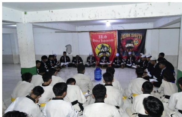
Gambar 4.11 istighosah atau berdoa bersama

Nah jadi saya sering menyampaikan pesan-pesan moral mas, yaa kadang sering menyisipkan kisah-kisah pejuang Islam dan juga pahlawan-pahlawan yang saleh, seperti itu mas. 79