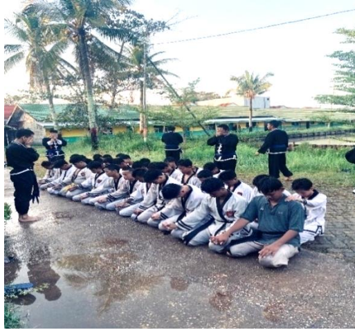
Gambar 4.10 Santri Berdoa Bersama Sebelum Memulai Latihan

Selain itu, kegiatan istighosah bersama, pengajian bulanan, serta penyampaian pesan-pesan moral oleh pelatih turut menjadi program Spiritualitas yang membentuk karakter santri. Seperti yang diungkapkan Raihan Azizi: