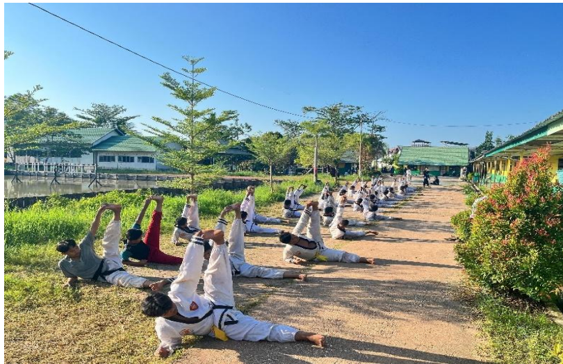
Gambar 4.4 Santri Aktif IKSPI Kera Sakti Pondok Pesantren Manba'ul'Ulum

Manba'ul'Ulum, jumlah santri yang aktif dalam latihan sempat mencapai lebih dari 80 orang. Namun, seiring waktu, pada tahun 2025 jumlah tersebut mengalami penurunan, dan hanya tersisa sekitar 40 santri yang masih aktif mengikuti latihan secara rutin.