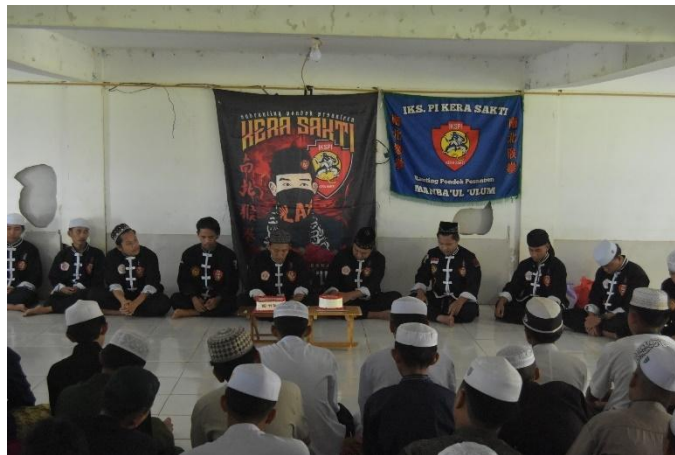
Gambar 4.6 Kegiatan Istighosah Bulanan Pembina, Pelatih, Pengurus dan Santri IKSPI Pondok Pesantren Manba'ul'Ulum

Di tingkat tahunan, organisasi IKSPI Kera Sakti di Pondok Pesantren Manba'ul'Ulum ini memiliki sejumlah agenda penting yang menjadi sarana evaluasi, pembinaan, serta penguatan identitas Spiritualitas dan ideologis anggota. Beberapa kegiatan tahunan yang rutin dilaksanakan antara lain: