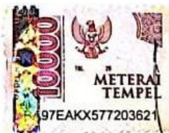
Siti Walya Azzahra

Banjarmasin, 13 Januari 2026 Yang Membuat Pernyataan,