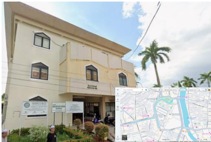
Gambar 4.1 Lokasi BAZNAS Provinsi Kalimantan Selatan