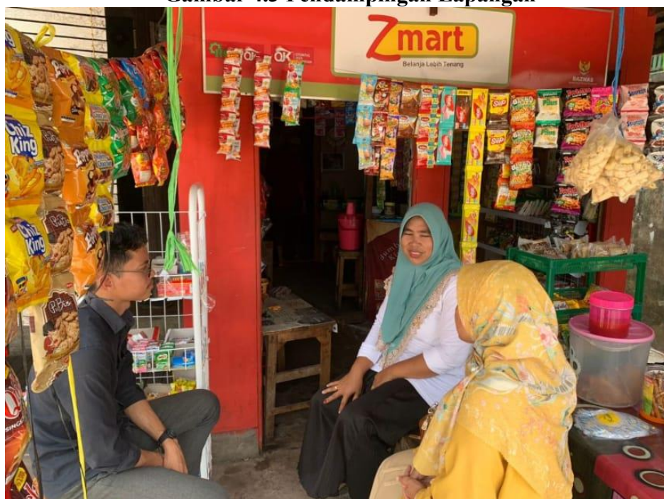
Gambar 4.3 Pendampingan Lapangan

Pelaksanaan pendampingan tidak hanya dilakukan melalui komunikasi administratif, tetapi juga melalui kunjungan langsung ke lokasi usaha mustahik. Pendampingan lapangan ini bertujuan untuk memastikan bantuan dimanfaatkan secara optimal serta memberikan arahan terkait pengelolaan usaha.