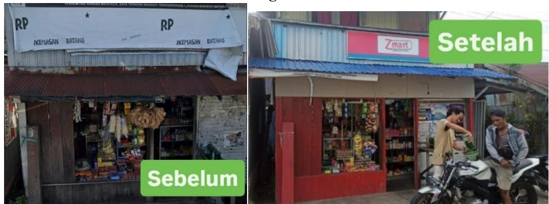
Gambar 4.4 Kondisi Warung Sebelum dan Setelah Bantuan