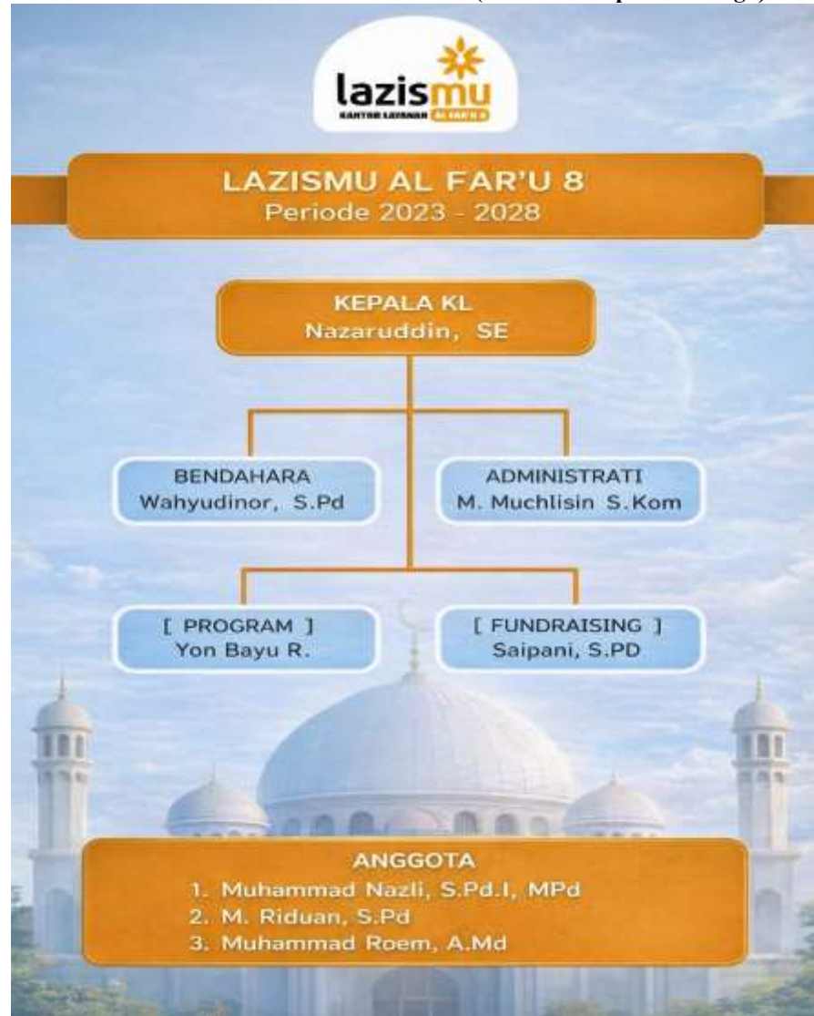
Gambar 4.2 Struktur LAZISMU Al-Far'u 8 (Sumber Arsipan Lembaga).

Sumber: LAZISMU Al- Far'u 8 Banjarmasin Tengah, 2026