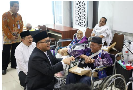
Gambar 4.8 Pelayanan Jemaah Lansia di Ruang Prioritas