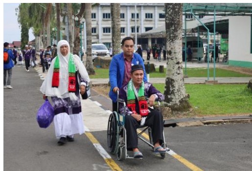
Gambar 4.9 Pendampingan Mobilitas Jemaah Lansia dengan Kursi Roda

Kalau gedung baru, pada umumnya sudah memenuhi kriteria ramah lansia ... yang dulu sebelum ada Tagline ramah lansia itu kan WC jongkok dan tidak ada railing ... itu semua dipenuhi di fasilitas-fasilitas publik.” 46