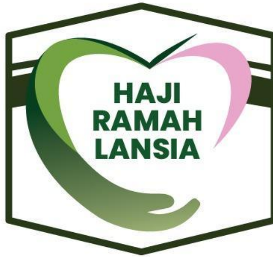
Gambar 4.3 Logo Program Haji Ramah Lansia

Dalam merumuskan strategi pelayanan lansia, Embarkasi Banjarmasin berpijak pada sejumlah acuan yang menjadi dasar dalam penyusunan pola layanan. Acuan tersebut bersumber dari kebijakan pusat, peraturan yang berlaku, arahan pimpinan, serta petunjuk teknis operasional.