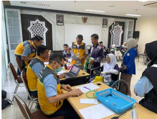
Gambar 4.7 Pemeriksaan Kesehatan Jemaah Lansia di Ruang Prioritas