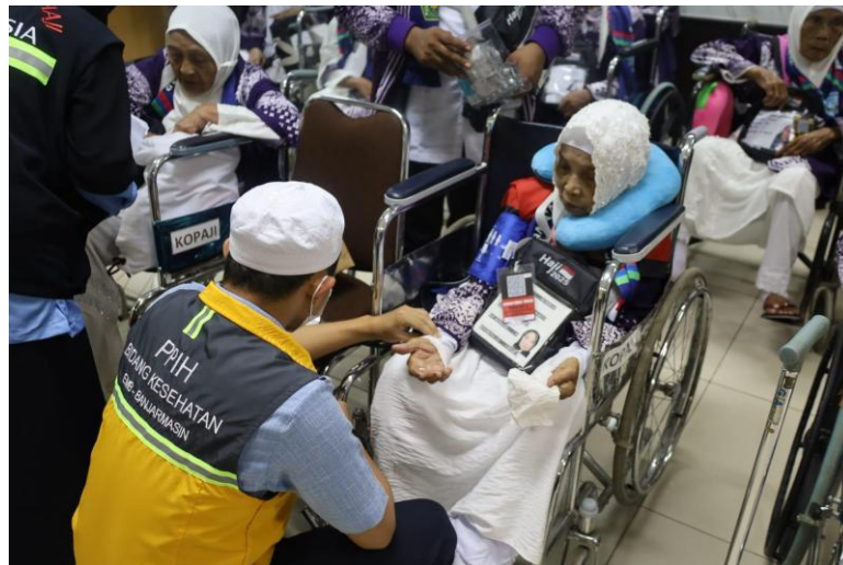
Gambar 4.4 Pemeriksaan Kesehatan Jemaah Lansia di Ruang Khusus

Rancangan alur tersebut juga terlihat dalam materi Layout One Stop Service dan simulasi alur pelayanan satu atap di embarkasi banjarmasin. Dokumen tersebut menunjukkan bahwa pelayanan dirancang agar beberapa unit kerja yang berkaitan dengan pemeriksaan kesehatan, penyerahan dokumen, living cost , dan gelang identitas dilaksanakan dalam satu pola layanan yang terkoordinasi. 14 Bahkan, dalam lampiran Kepdirjen Nomor 185 Tahun 2023 disebutkan bahwa di area ruang tunggu penerimaan disiapkan dua baris terdepan sebagai tempat duduk prioritas bagi lansia. 15 Hal ini memperlihatkan bahwa perumusan alur layanan tidak hanya