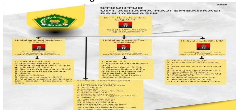
Gambar 4. 2 Struktur Pegawai