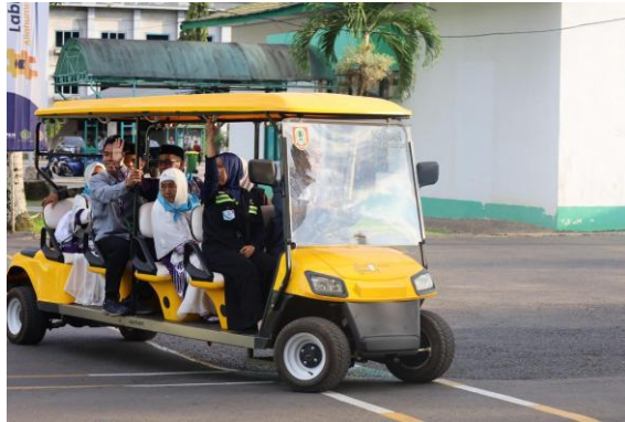
Gambar 4.10 Fasilitas Mobil Golf untuk Mendukung Mobilitas Jemaah Lansia

Hal ini juga diperkuat dengan hasil observasi peneliti, UPT Asrama Haji Embarkasi Banjarmasin telah melakukan penyesuaian fasilitas fisik yang mendukung pelayanan ramah lansia, yaitu jalur akses kursi roda, mobil golf dan juga salah satunya melalui pemasangan railing atau pegangan tangan pada titik-titik krusial. Pegangan tangan tersebut terlihat dipasang pada area yang membutuhkan penopang tambahan, terutama di toilet, sehingga memudahkan jemaah lansia dalam bergerak, menjaga keseimbangan, serta mengurangi risiko terpeleset atau jatuh.