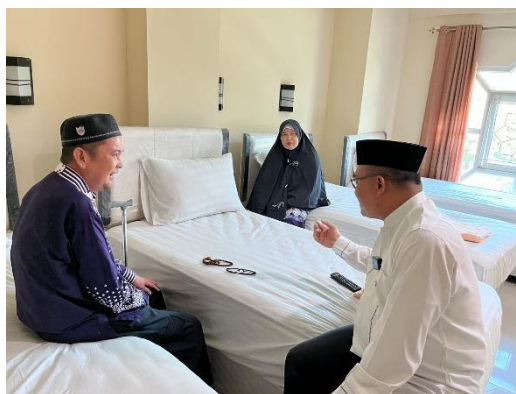
Gambar 4.11 Manasik Khusus dan Pendampingan Jemaah Lansia di Kamar

Perbedaan paling menonjol antara manasik jemaah umum dan manasik lansia terletak pada tempat, metode, materi, dan pola pendampingannya. Jemaah umum menerima materi secara kolektif di masjid, sedangkan jemaah lansia menerima bimbingan langsung di kamar. Jemaah umum diarahkan untuk memahami keseluruhan alur ibadah dan perjalanan haji, sedangkan jemaah lansia lebih diarahkan pada hal-hal pokok, seperti rukun haji, wajib haji, penggunaan kursi roda, pentingnya menunggu giliran, istirahat yang cukup, serta pilihan kemudahan seperti safari wukuf, murur, dan tanazul. Hal ini menunjukkan bahwa Program Haji Ramah Lansia di UPT Asrama Haji Embarkasi Banjarmasin benar-benar diwujudkan melalui penyesuaian layanan sesuai kondisi jemaah, bukan hanya dalam bentuk fasilitas fisik, tetapi juga dalam cara membimbing, mendampingi, dan memperlakukan jemaah lansia secara lebih manusiawi.