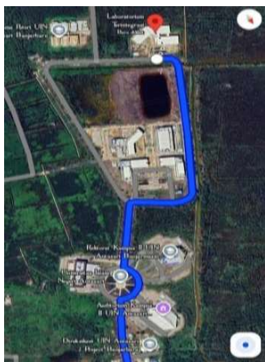
Gambar 3.3 Lokasi Penelitian

Penelitian ini dilaksanakan di Laboratorium Terintegrasi Tadris Biologi, Fakultas Tarbiyah dan Keguruan, Universitas Islam Negeri Antasari Banjarmasin yang berlokasi di Kampus II Banjarbaru. Pengambilan Hydrilla verticillata dilakukan di wilayah Landasan Ulin, Komplek Griya Utama Trikora 8, Banjarbaru. Pemilihan lokasi penelitian didasarkan pada kesesuaian dengan fokus penelitian, yaitu pengembangan perangkat pembelajaran pada mata kuliah Fisiologi Tumbuhan melalui Lembar Kerja Mahasiswa (LKM). Program Studi Tadris Biologi dipilih karena pelaksanaan mata kuliah Fisiologi Tumbuhan berlangsung di lokasi tersebut serta menjadi tempat uji coba produk yang dikembangkan. Selain itu, mahasiswa pada program studi ini dinilai relevan sebagai subjek penelitian karena telah mempelajari materi yang berkaitan dengan fisiologi tumbuhan, khususnya fotosintesis, sehingga dapat memberikan umpan balik terkait kepraktisan dan penggunaan LKM yang dikembangkan.