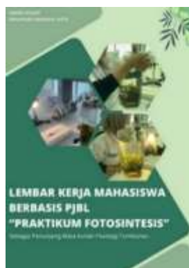
Gambar 3.1 Sampul Lembar Kerja Mahasiswa

Dalam penelitian ini, peneliti melakukan berbagai persiapan yaitu mengumpulkan data, mengolah data, hingga menyusun Lembar Kerja Mahasiswa (LKM). Data yang telah diperoleh selanjutnya dianalisis, diinterpretasikan, dan dikembangkan menjadi materi praktikum yang sesuai untuk pembelajaran Fisiologi Tumbuhan. Dalam proses penyusunan LKM, tujuan pembelajaran pada materi fotosintesis ditetapkan, hasil penelitian dihimpun, serta referensi digunakan sebagai dasar teori. Adapun jenis sampul Lembar Kerja Mahasiswa (LKM) yang dikembangkan oleh peneliti adalah sebagai berikut: