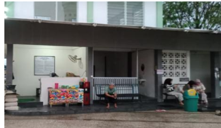
Ruang Istirahat Jemaah