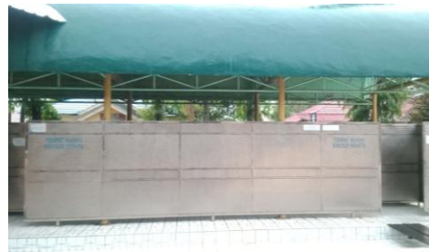
Tempat Wudhu Wanita