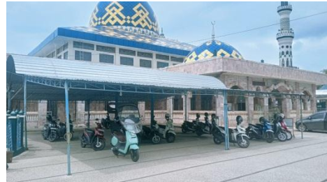
Lahan Parkir Masjid