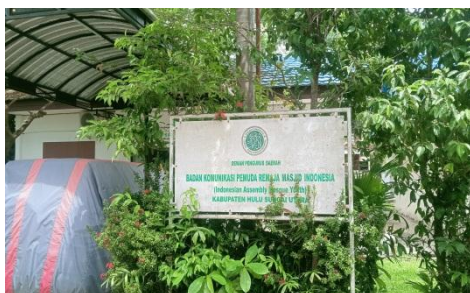
Ruang Sekretariat Pemuda Masjid