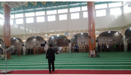
Suasana Sholat Fardhu Berjamaah