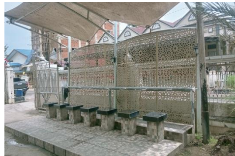
Tempat Wudhu Pria