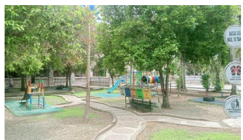
Ruang Bermain Anak