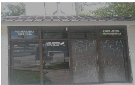
Ruang Ibu Menyusui