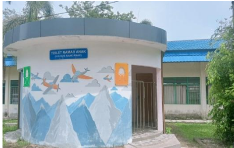
Toilet Ramah Anak