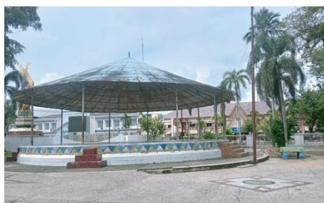
Panggung Halaman Masjid