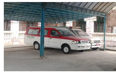
Mobil Ambulance Masjid