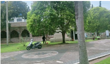
Petugas Kebersihan Masjid