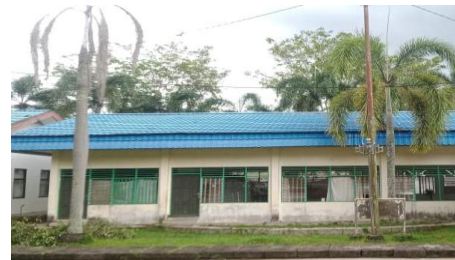
Ruang TK/TPA Masjid