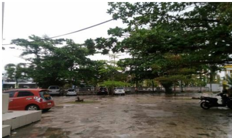
Tempat Parkir Mobil