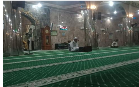
Pengajian Rutinan Malam