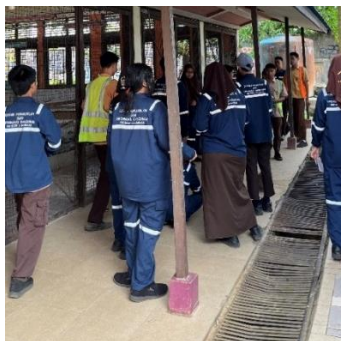
Gambar 4.3. Interaksi siswa dalam persiapan praktik di SMK Negeri 5 Banjarmasin

Gambar berikut menunjukkan suasana interaksi siswa dalam kegiatan pembelajaran: