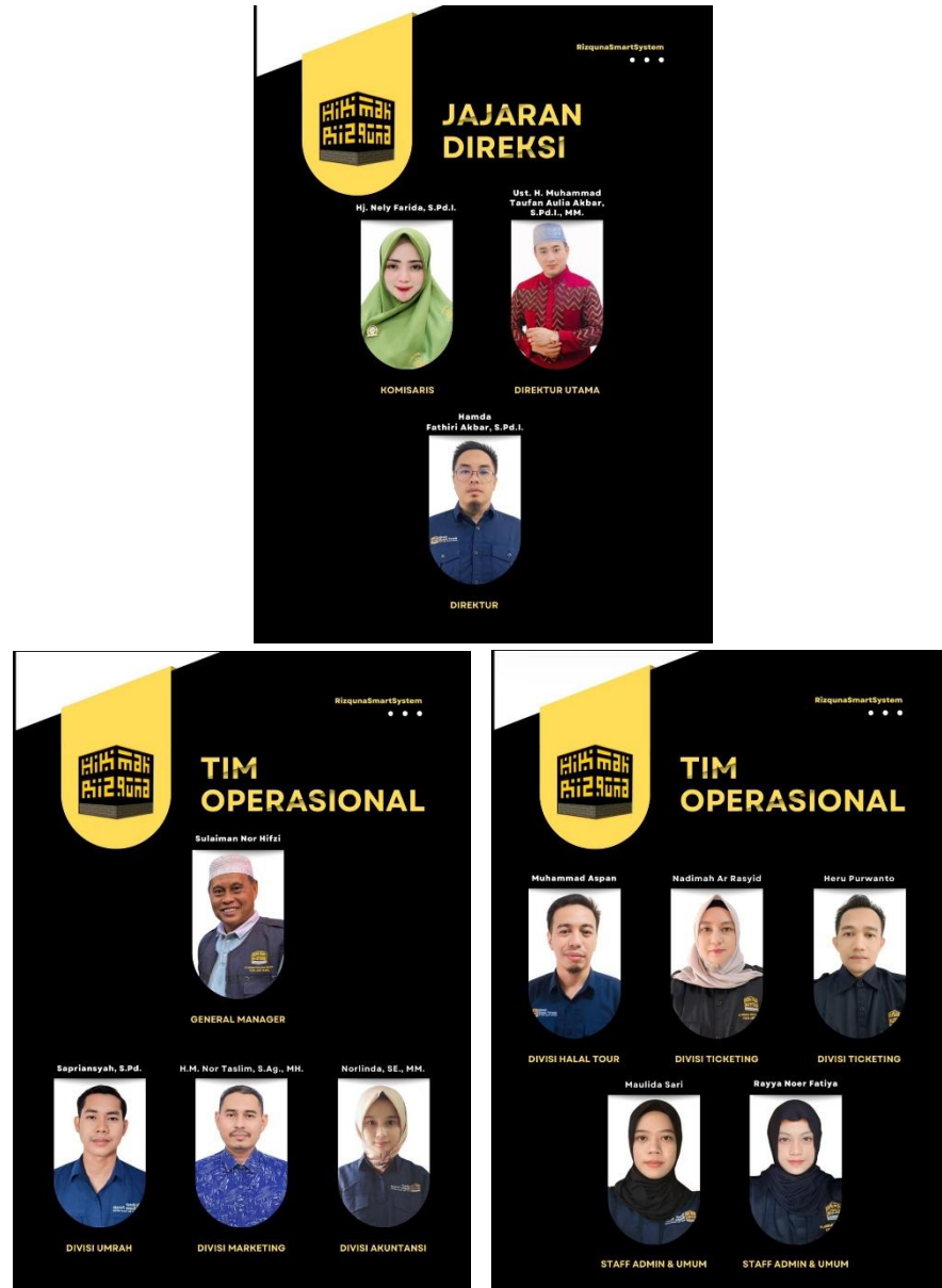
Gambar 4. 2 Struktur Organisasi PT. Hikmah Rizquna Persada Periode 2025 - Sekarang