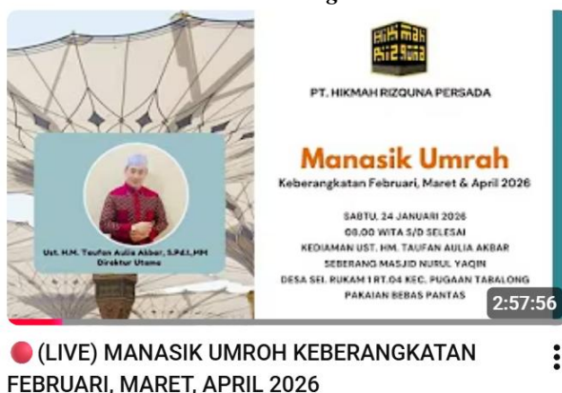
Gambar 4. 5 Live Streaming Manasik Umrah