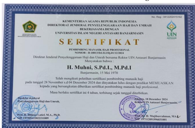
Gambar 4.3 Sertifikasi Pembimbing Manasik

Dengan adanya kriteria tersebut, perusahaan berupaya menjaga kualitas pembimbing agar jemaah memperoleh pemahaman yang benar dan dapat melaksanakan ibadah sesuai dengan tuntunan yang telah ditetapkan.