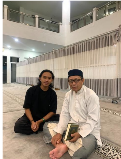
Foto bersama Petugas Kebersihan