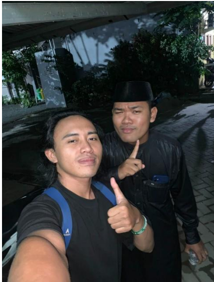
Foto bersama Penasehat Masjid