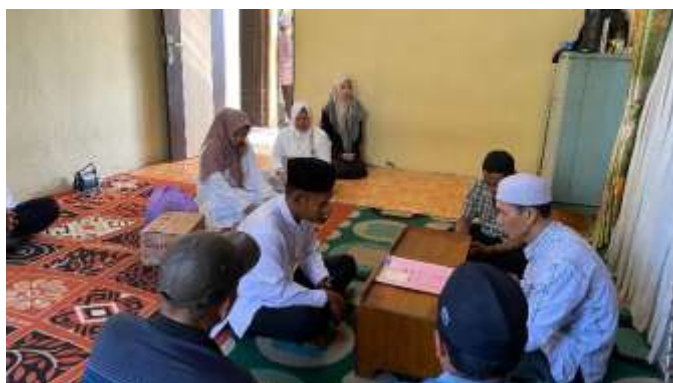
Pelaksanaan Akad Nikah di Balai Nikah KUA Kecamatan Kapuas Timur