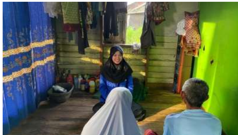
Wawancara dengan Pasangan Nikah Siri Bapak FL dan Ibu K