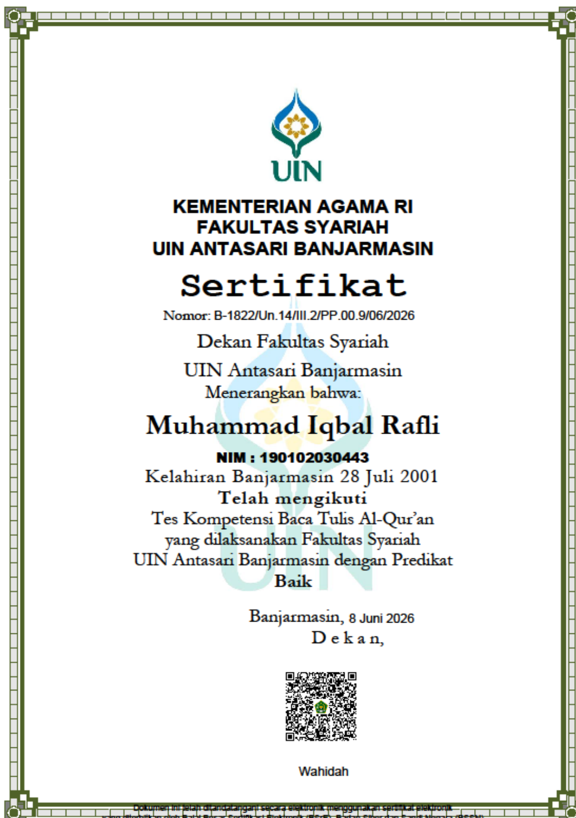
Lampiran 11. Sertifikat Baca Tulis Al-Qur'an