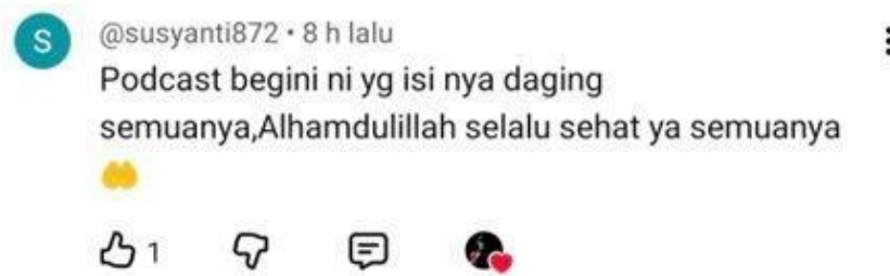
Gambar 4.6 Bukti Kutipan Respon Positif (2)