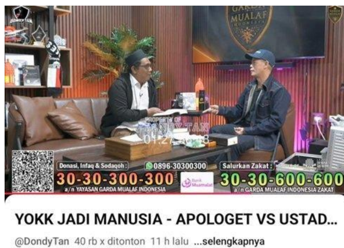
Gambar 4.4 Konten "Yokk Jadi Manusia"