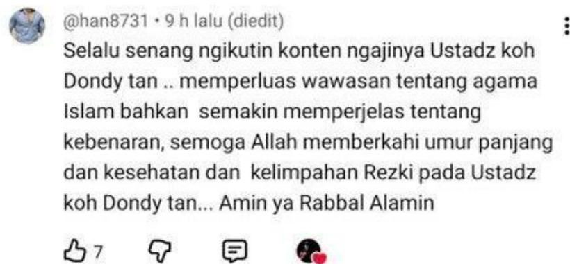
Gambar 4.5 Bukti Kutipan Respon Positif (1)