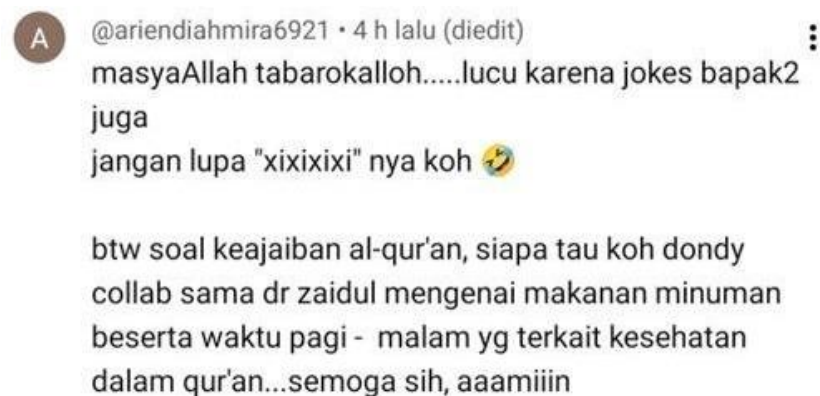
Gambar 4.9 Bukti Kutipan Respon Positif (3)