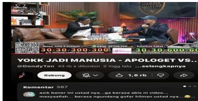
Gambar 3.1 Tangkapan Layar Video "Yokk Jadi Manusia"