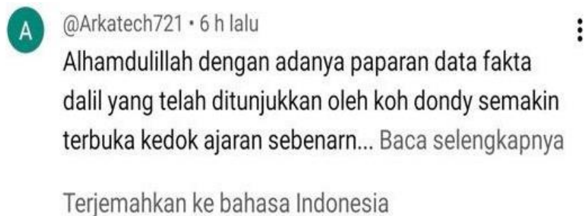
Gambar 4.7 Bukti Kutipan Respon Terhadap Materi (1)