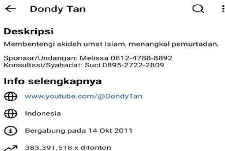
Gambar 4.2 Deskripsi Kanal YouTube Dondy Tan