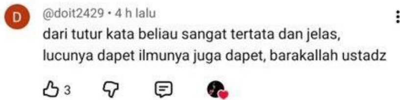
Gambar 4.12 Bukti Kutipan Respon Positif (4)