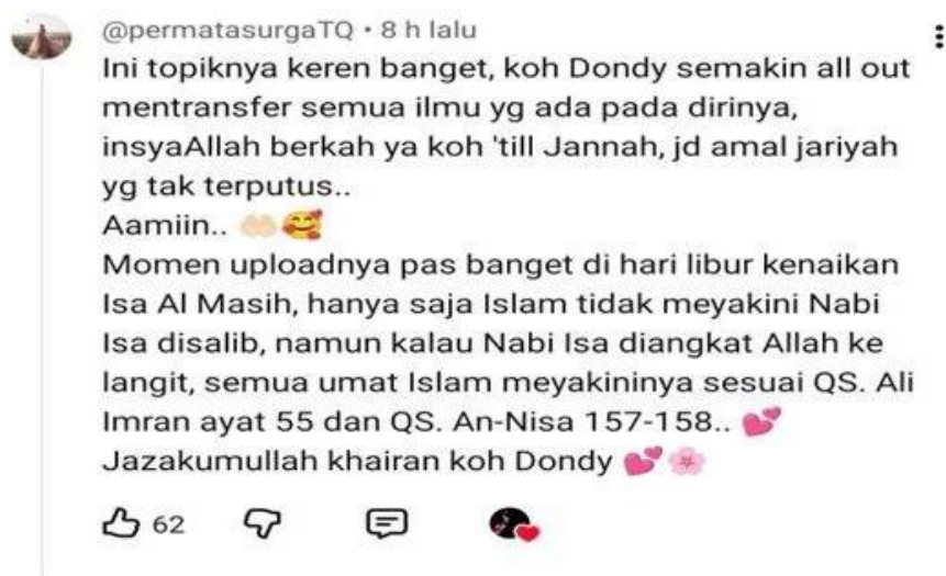
Gambar 4.10 Bukti Kutipan Respon Terhadap Materi (2)