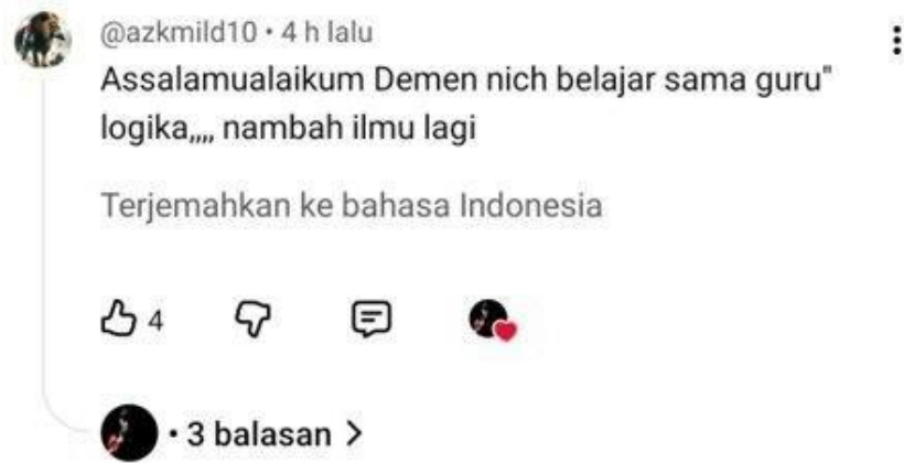
Gambar 4.13 Bukti Kutipan Respon Terhadap Materi (3)