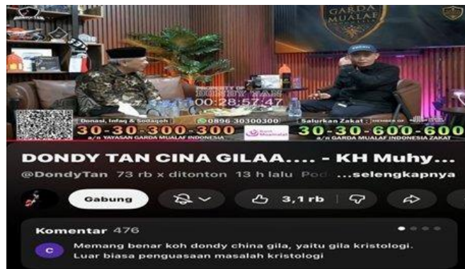
Gambar 3.2 Tangkapan Layar Video "Dondy Tan Cina"

@DondyTan 65 rb x ditonton 7 h lalu ...selengkapnya