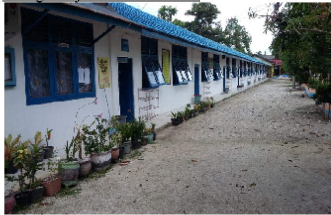
Ruang Belajar/Kelas santriwati