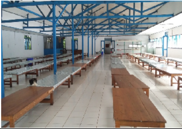
Ruang Makan santriwati PonPes Al-Falah Puteri