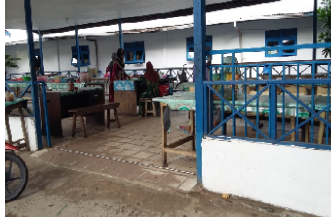
Kantin PonPes Al-falah Puteri