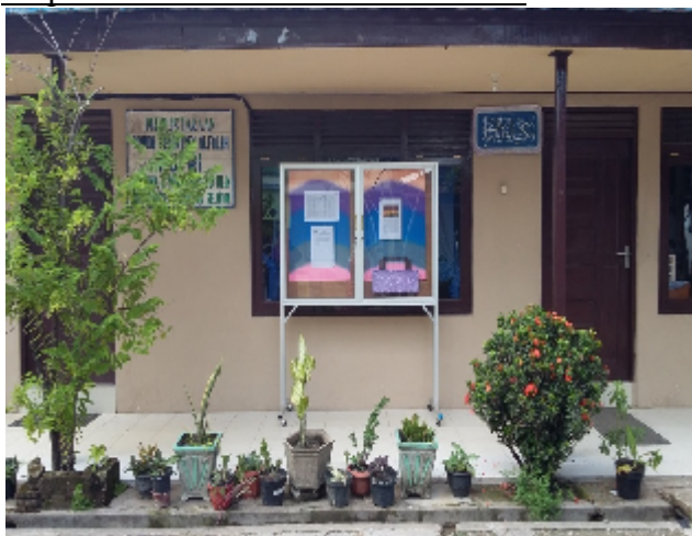
Perpustakaan PonPes Al-Falah Puteri