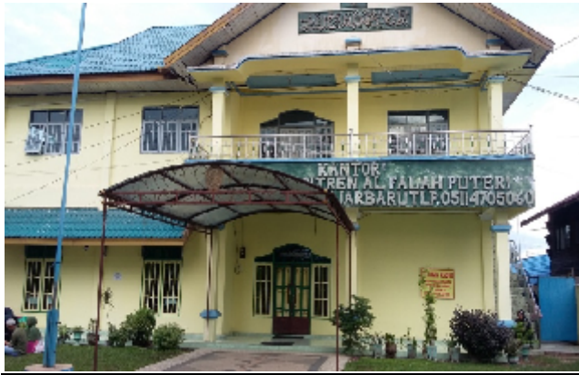
Kantor Yayasan Pondok Pesantren Al-falah Puteri