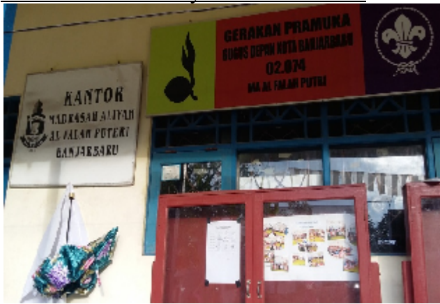
Kantor Madrasah Aliyah Al-Falah Puteri