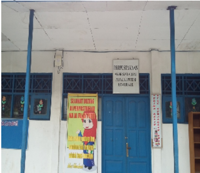
Perpustakaan MA Al-Falah Puteri