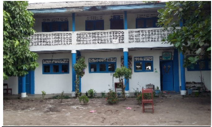
Ruang belajar/Asrama Santriwati Kelas Khusus PonPes Al-falah Puteri