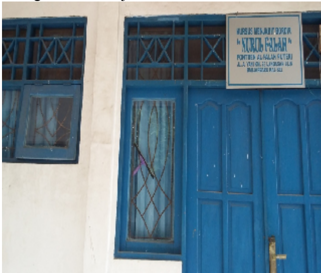
Ruang Kursus menjahit PonPes Al-Falah Puteri