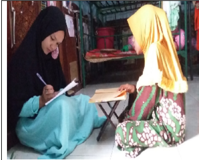
Foto-foto keadaan Gedung dan Fasilitas di PonPes Al-falah Puteri