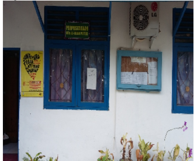
Perpustakaan MTs Al-Falah Puteri