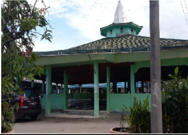
Musholla PonPes Al-Falah Puteri