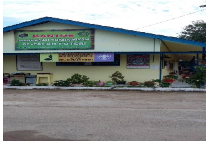
Kantor Madrasah Tsanawiyah Al-Falah Puteri