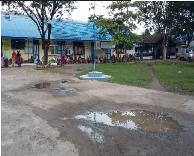
Lapangan PonPes Al-Falah Puteri