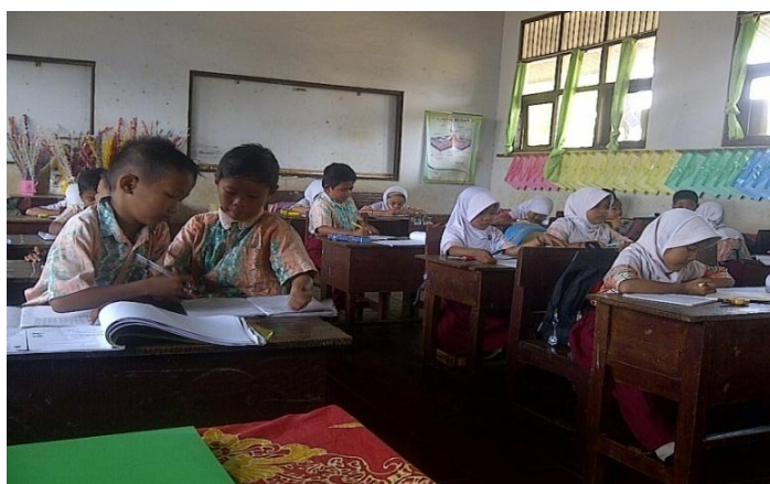
Gambar 4.1 Suasana belajar di kelas eksperimen