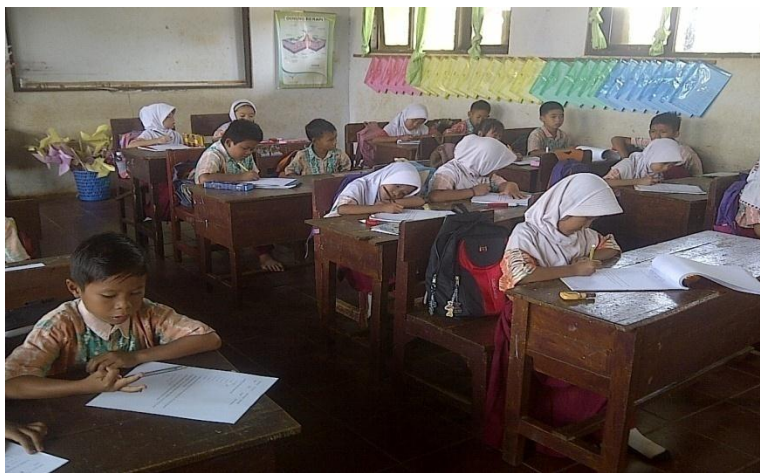
Gambar 4.2 Suasana Siswa saat Menjawab Soal Tes Akhir

Guru memberikan arahan dalam belajar kelompok. Selama diskusi berlangsung, guru memantau kerja tiap kelompok dan membantu kelompok yang mengalami kesulitan.