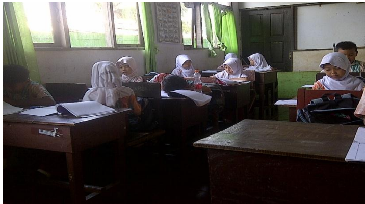
Gambar 4.2 Suasana belajar di kelas kontrol