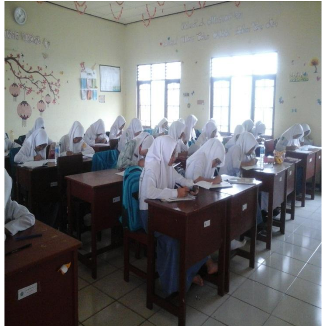
SISWA-SISWI SEDANG MENGADAKAN UTS MATA PELAJARAN MATEMATIKA DIKELAS X MAN PULANG PISAU (Tgl. 20 Oktober 2015)