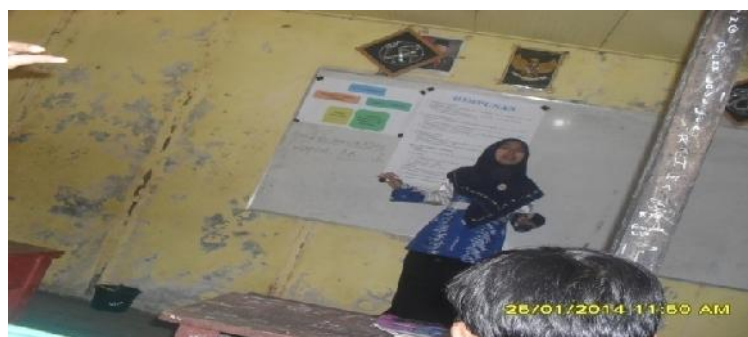
Gambar 4.3 Penyajian materi oleh guru

Guru menyajikan informasi tentang materi himpunan, materi tersebut terdapat semuanya di caption yang telah dipersiapkan oleh guru. Siswa memperhatikan penjelasan tersebut, meskipun ada beberapa siswa yang membuat keributan. Setelah selesai menyajikan informasi, guru mengadakan tanya jawab dengan siswa untuk mengetahui pemahaman terhadap materi yang telah diberikan, dan memberikan kesempatan yang sama kepada setiap siswa untuk bertanya. Siswa bertanya dengan antusias.