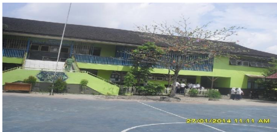
Gambar 4.1 Keadaan Sarana dan Prasarana MTs Al-Ikwan Banjarmasin

ruang WC guru. Tiga belas ruang kelas tersebut terdiri atas empat kelas VII, empat kelas VIII, dan lima kelas IX. Untuk lebih jelasnya lihat pada lampiran 13.