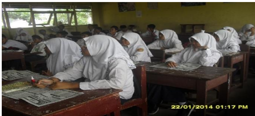
Gambar 4.2 Suasana belajar saat pembelajaran berlangsung