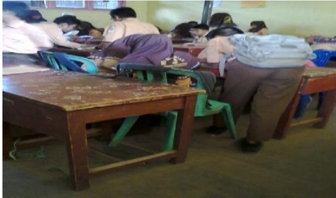
Gambar 4.4 Aktivitas siswa dalam kelompok

Pada saat tes akhir, selama diskusi berlangsung hampir semua siswa tidak mengerti apa yang harus mereka lakukan untuk menjawab soal tersebut, karena ini adalah pertama kalinya mereka berkelompok dengan mengisi Word Square atau mirip dengan Teka Teki Silang (TTS). Hal inilah yang membuat suasana kelas menjadi ribut. Namun, setelah diarahkan beberapa kali semua siswa dapat menjawab soal tersebut meskipun masih ada keributan.