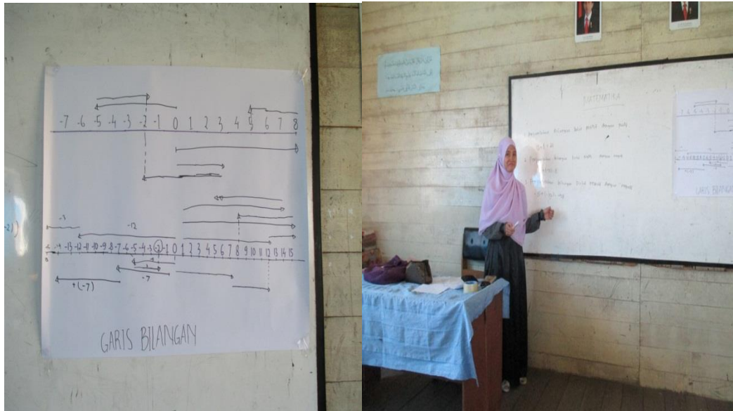
Gambar 22. Penjelasan Materi di kelas eksperimen 2