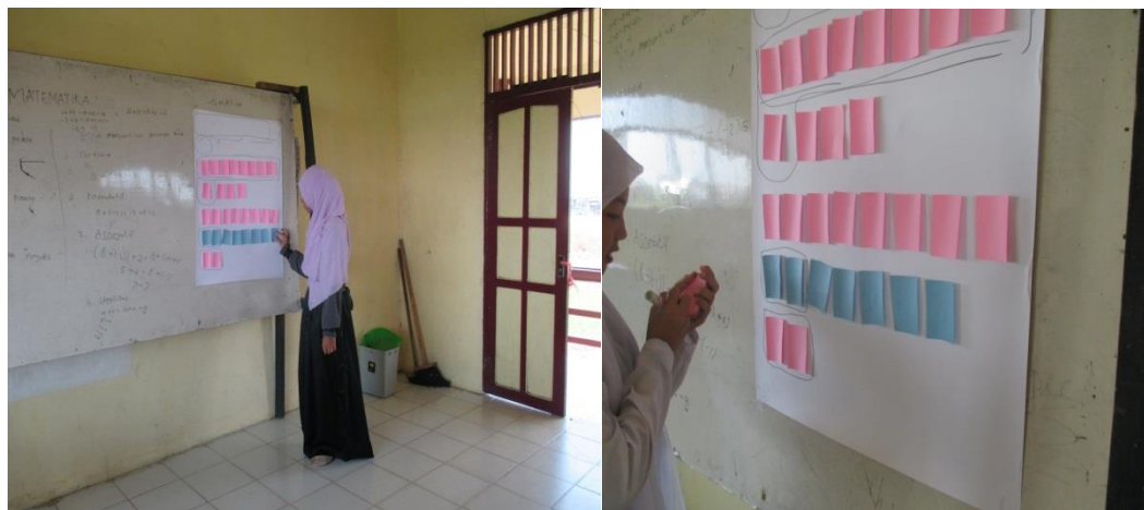
Gambar 22. Penjelasan Materi di kelas eksperimen 1

kartu posinega. Pertama-tama mengenalkan bahwa ada 2 kartu berwarna biru dan merah muda. Untuk warna merah muda menunjukkan bilangan bulat negatif dan kartu berwarna biru menunjukkan bilangan bulat positif, jika sebuah kartu biru (positif) dipasangkan dengan kartu yang warna merah muda (negatif) maka hasilnya adalah 0. Setelah materi dijelaskan peneliti memberikan kesempatan kepada siswa untuk menanyakan hal-hal yang mungkin belum dimengerti, kemudian peneliti meminta siswa untuk membentuk kelompok dan mengerjakan soal yang telah disediakan.