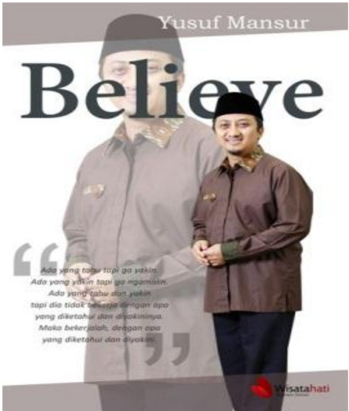
Gambar 3: Cover Buku Believe