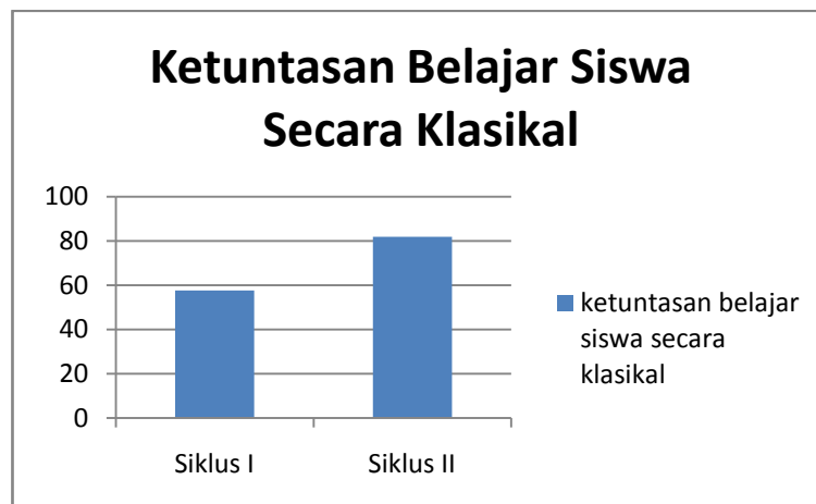
Gambar 10. Diagram ketuntasan belajar siswa secara klasikal

mencapai ketuntasan minimal. Peningkatan ketuntasan belajar siswa pada siklus I dan siklus II dapat disajikan dalam diagram berikut.