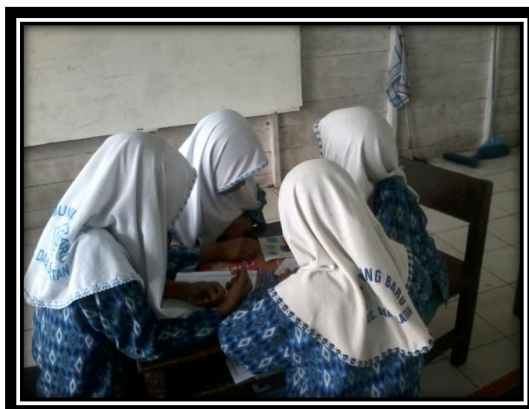
Gambar 4. Siswa bekerjasama membuat hasil karya untuk memecahkan masalah