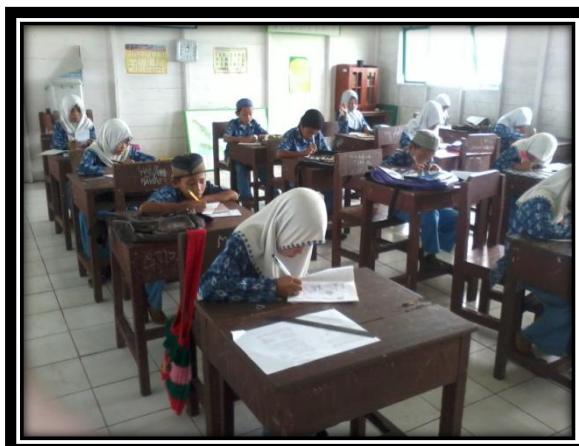
Gambar 8. Suasana saat evaluasi siklus II dilaksanakan