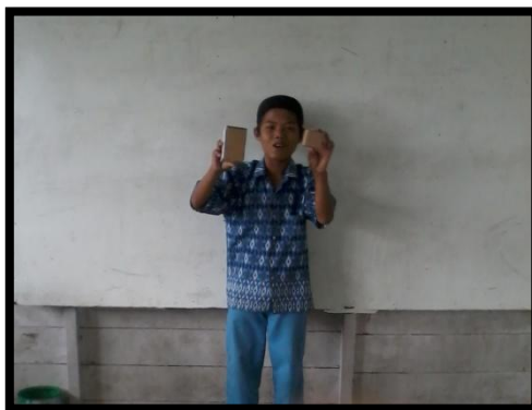
Gambar 6. Salah satu anggota kelompok mempresentasikan hasil diskusinya dan guru meminta kelompok lain menanggapi

Guru memberikan penguatan terhadap langkah-langkah pemecahan masalah-masalah yang diberikan dengan menjelaskan kembali langkah-langkah pemecahan masalah. Di akhir proses pembelajaran guru membimbing siswa menyimpulkan materi yang diajarkan, kemudian guru memberikan PR kepada siswa.