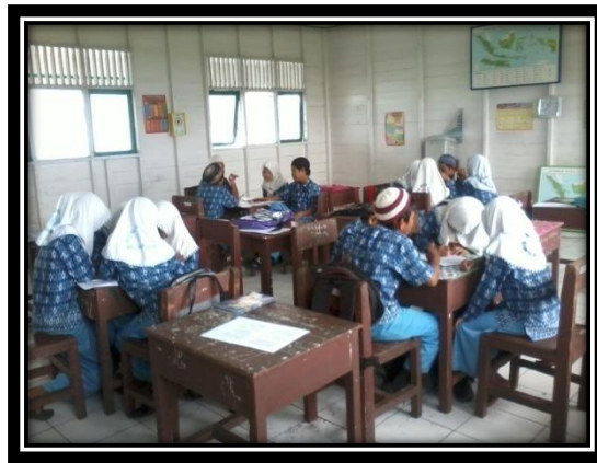
Gambar 3. Siswa membentuk kelompok-kelompok kecil