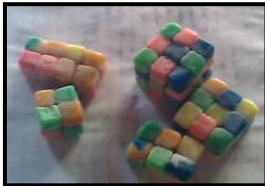
Gambar 7. Alat peraga yang digunakan untuk pertemuan kedua dan ketiga siklus II

Proses diskusi, presentasi dan pemberian tanggapan dilaksanakan sesuai prosedur yang sama dengan pertemuan sebelumnya. Pada pertemuan ini semua proses berlangsung lebih baik dari pertemuan sebelumnya. Guru memberikan penguatan terhadap jawaban siswa dengan menerangkan kembali langkah-langkah penyelesaian masalah yang telah dipresentasikan siswa.