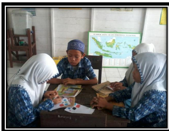
Gambar 5. Siswa bekerjasama menyelesaikan tugas yang diberikan

Untuk menyelesaikan permasalahan yang diberikan, guru membagikan LTK kepada setiap siswa, selain LTK guru juga memberi lembar permasalahan kepada setiap kelompok, masalah yang diberikan berbeda untuk setiap kelompoknya dan setiap dua kelompok memiliki lembar permasalahan yang sama.