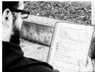
Over Shoulder Shot