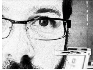
Extreme close up