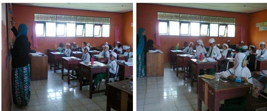
Gambar 4.1.Suasana Belajar di Kelas Kontrol

Suasana belajar di kelas kontrol dapat dilihat pada gambar berikut: