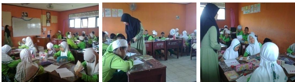
Gambar 4.2 Suasana Belajar di Kelas Eksperimen

Suasana belajar di kelas eksperimen dapat dilihat pada gambar berikut.