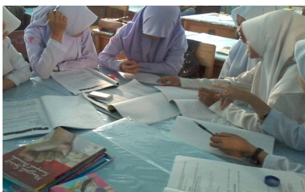
Gambar 4. 2. aktivitas ketika berdiskusi kelompok

Aktivitas siswa ketika melakukan diskusi kelompok dapat dilihat pada gambar berikut ini.