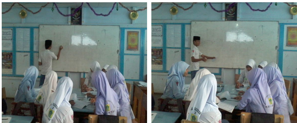
Gambar 4. 3. Aktivitas siswa ketika presentasi hasil diskusi

Aktivitas siswa ketika melakukan presentasi dapat dilihat pada gambar berikut ini.