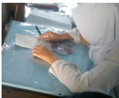
Gambar 4. 1. Aktivitas siswa ketika mengerjakan pretes

Aktivitas siswa ketika melakukan pretes dapat dilihat pada gambar berikut ini.