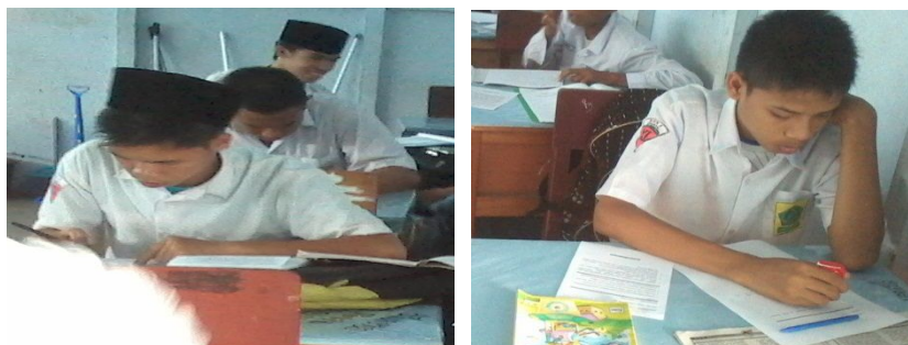
Gambar 4. 4. Siswa ketika mengerjakan postes