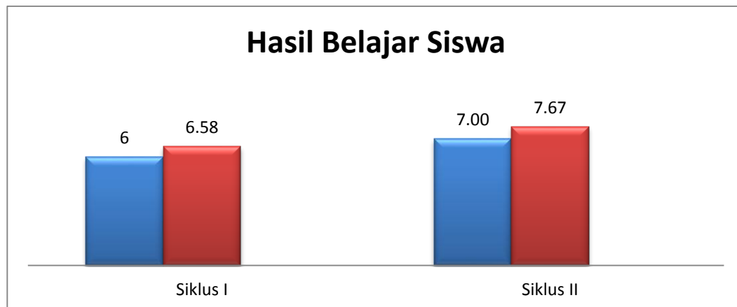
Gambar 4.3 Hasil Belajar Siswa

Berdasarkan data pada gambar 4.3 di atas, bahwa tindakan kelas untuk meningkatkan hasil belajar siswa melalui strategi pembelajaran make a mach pada mata pelajaran IPA siswa kelas V MI At Taqwa dinyatakan berhasil dan tujuan pembelajaran tercapai. Hal ini dibuktikan dari hasil belajar siswa pada pelaksanaan siklus I sampai dengan siklus II yang menunjukkan adanya peningkatan, Dari nilai rata-rata 6 pada pertemuan pertama siklus I menjadi 7,67 pada pertemuan kedua siklus II.