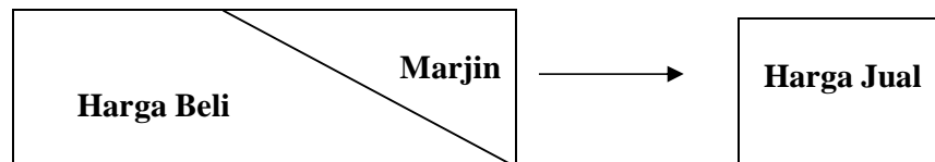
Gambar 3.3 99 Ilustrasi Harga Jual Murabahah Dengan Metode Anuitas

Pembiayaan Murabahah diakui pada saat akad transaksi pembiayaan murabahah sebesar nilai perolehan barang ditambah margin/keuntungan yang disepakati oleh Bank Kalsel Syariah dan Nasabah. Dalam hal Bank Kalsel Syariah menggunakan metode anuitas maka pembiayaan murabahah yang diakui termasuk pendapatan dan beban yang terkait langsung dengan transaksi murabahah .