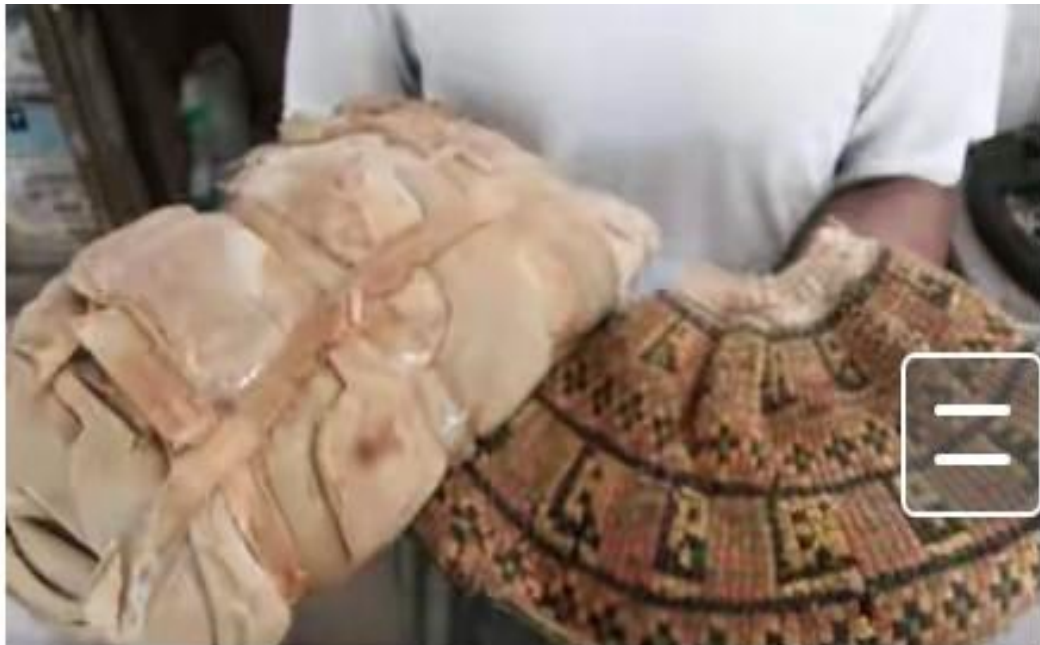
Jubah dan Kopiah Syekh Muhammad Arsyad Al-Banjary