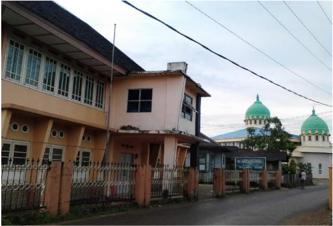
Pondok Sullamul Ulum