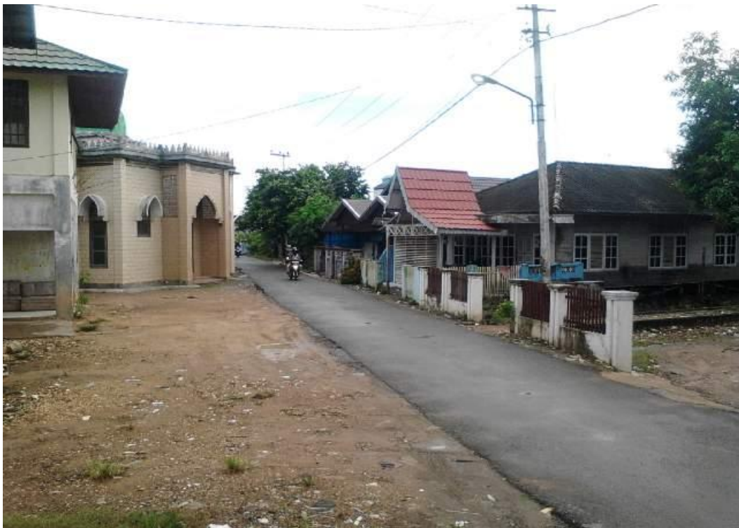
Desa Dalam Pagar Sekarang