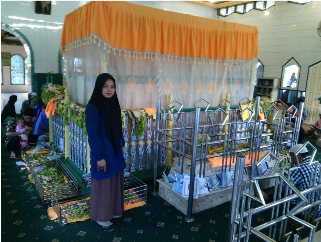
Makam Syekh Muhammad Arsyad Al-Banjary