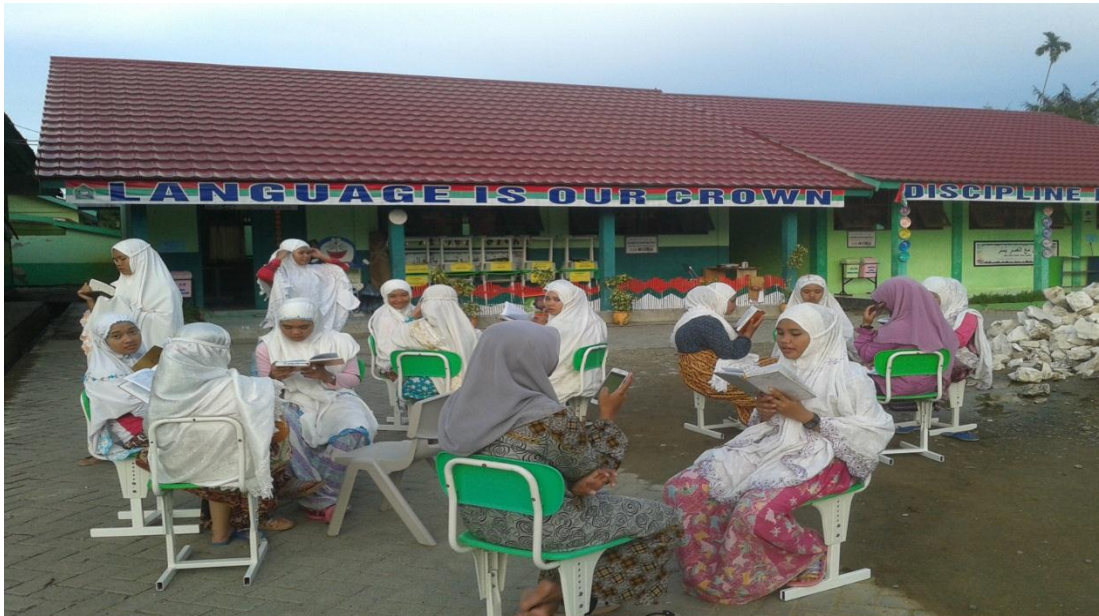
Keterangan: Santriwati sedang menghafal surah-surah pada Juz 'Amma dan surah-surah pilihan.