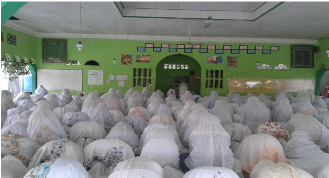
Keterangan: Santriwati sedang melaksanakan salat rawatib.