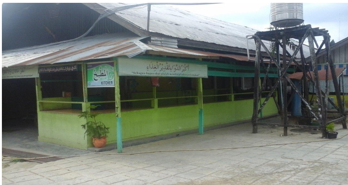
Keterangan: Kondisi dapur. Di tempat ini pun diajarkan akhlak secara tidak langsung (bisa dilihat tulisan kaligrafi yang menempel di sana), isinya “Sebagus-bagusnya Obat adalah Mendisiplinkan Pola Makan”. Hal ini mengajarkan kepada santriwati untuk menjaga diri agar tetap sehat (akhlak terhadap diri sendiri).