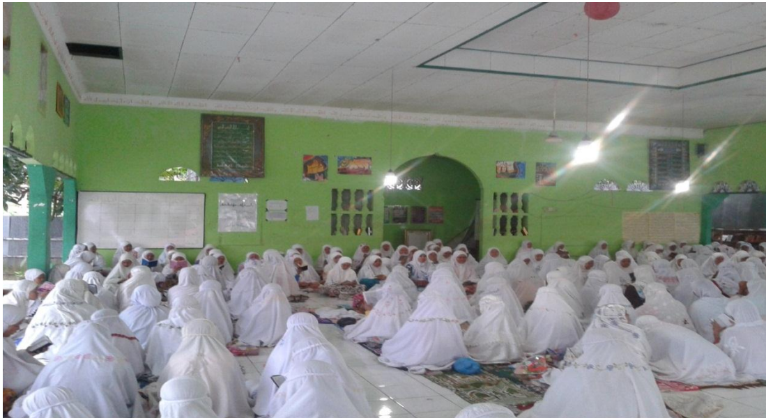
Keterangan: Kegiatan tadarus Alquran di musala