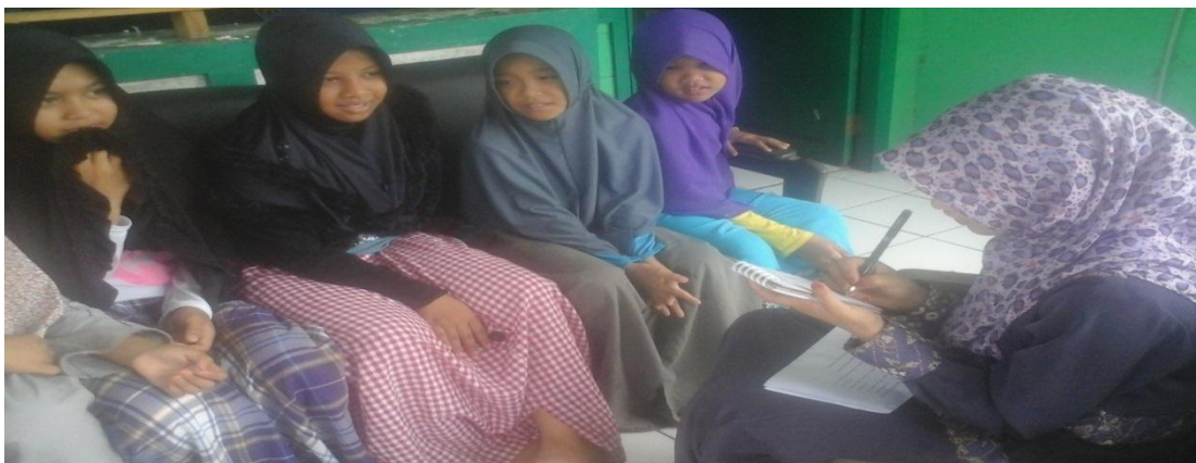
Keterangan: Kegiatan wawancara penulis dengan informan (Santriwati kelas 1 MTs)