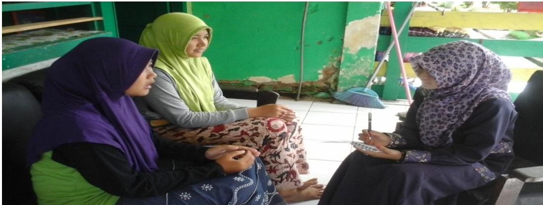
Keterangan: Kegiatan wawancara penulis dengan anggota OPPM (responden).