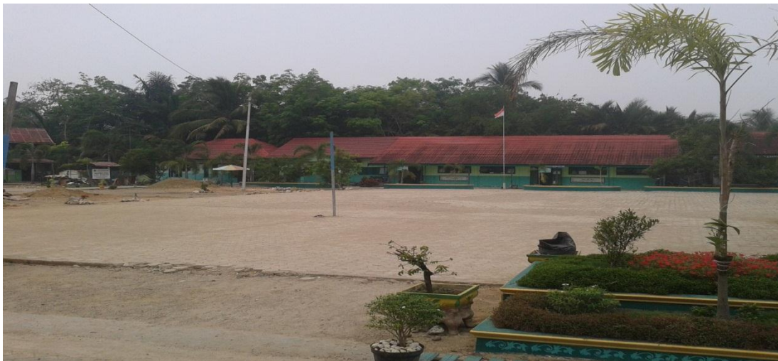
Keterangan: Keadaan Lapangan