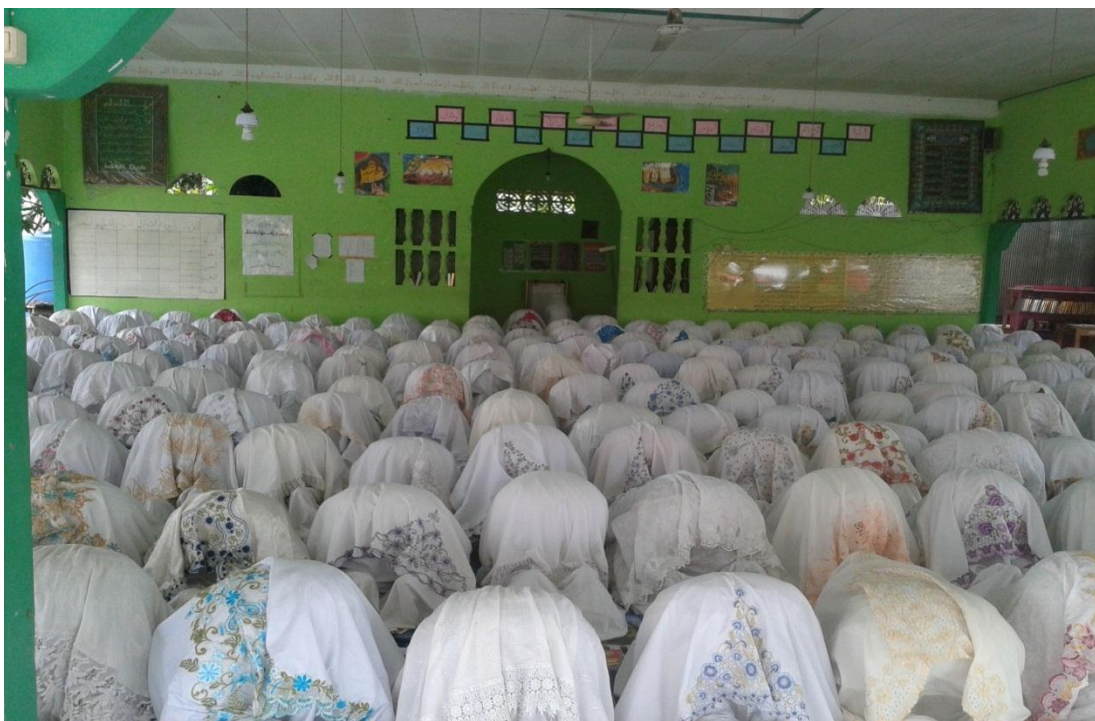
Keterangan: Salat Zuhur berjamaah.