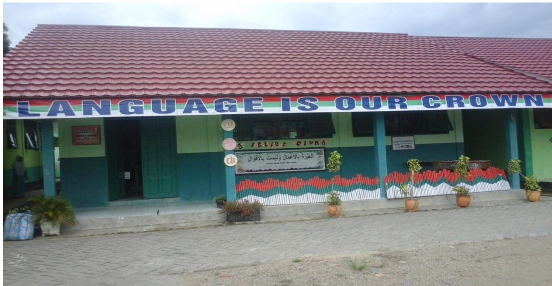
Keterangan: Kondisi depan kelas