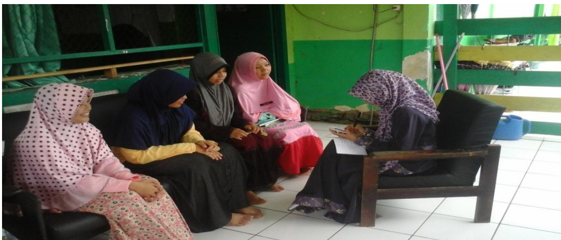
Keterangan: Kegiatan wawancara penulis dengan informan (kelas 1 MA)