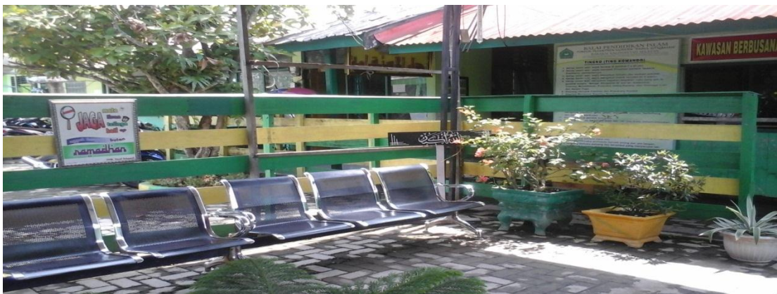
Keterangan: Ruang tamu, di sini terdapat slogan/poster (lihat pojok kiri), mengajarkan kepada santriwati untuk tetap menjaga akhlak di manapun & kapanpun.