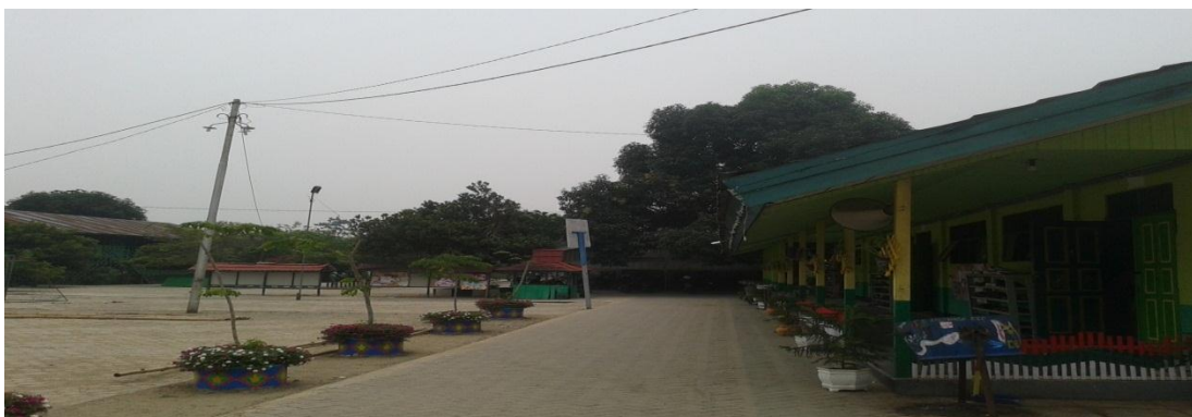
Keterangan: Kondisi depan kamar santriwati