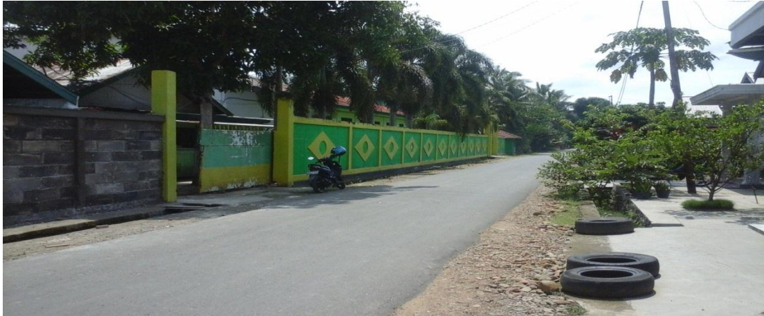
Keterangan: Lokasi Penelitian dilihat dari sisi luar/gerbang