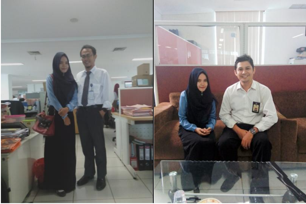
Foto bersama ketua seksi pengawasan dan karyawan Account Representative