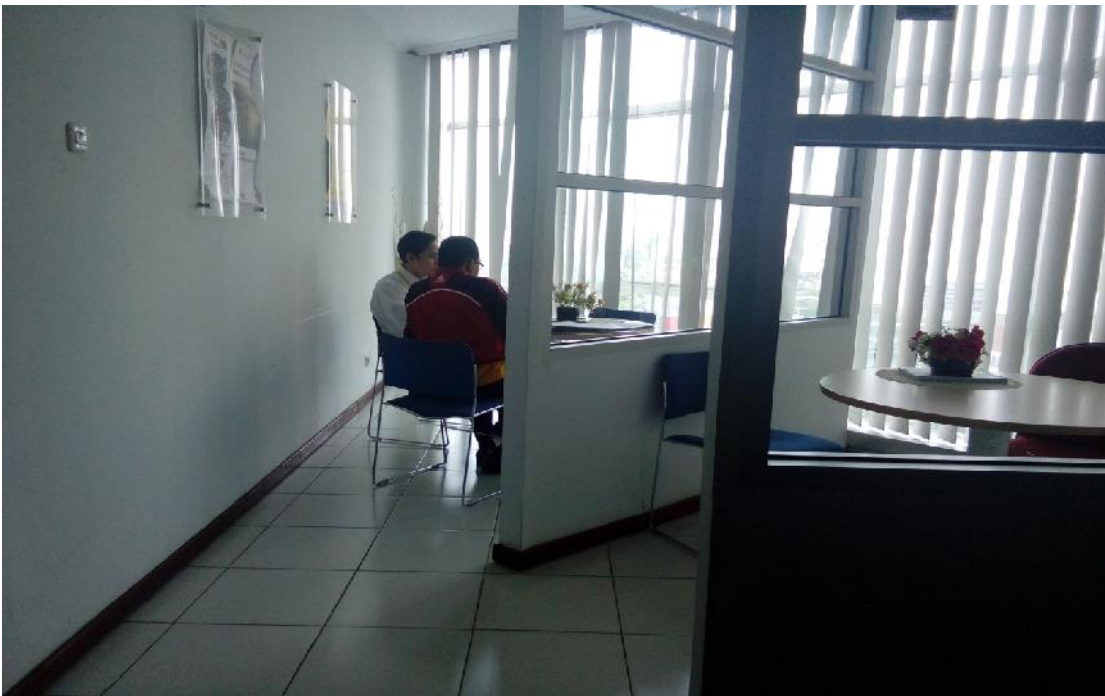
Ruang Konsultasi Wajib Pajak