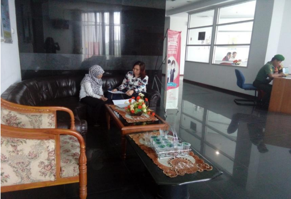
Konsultasi Wajib Pajak dengan petugas Account Representative