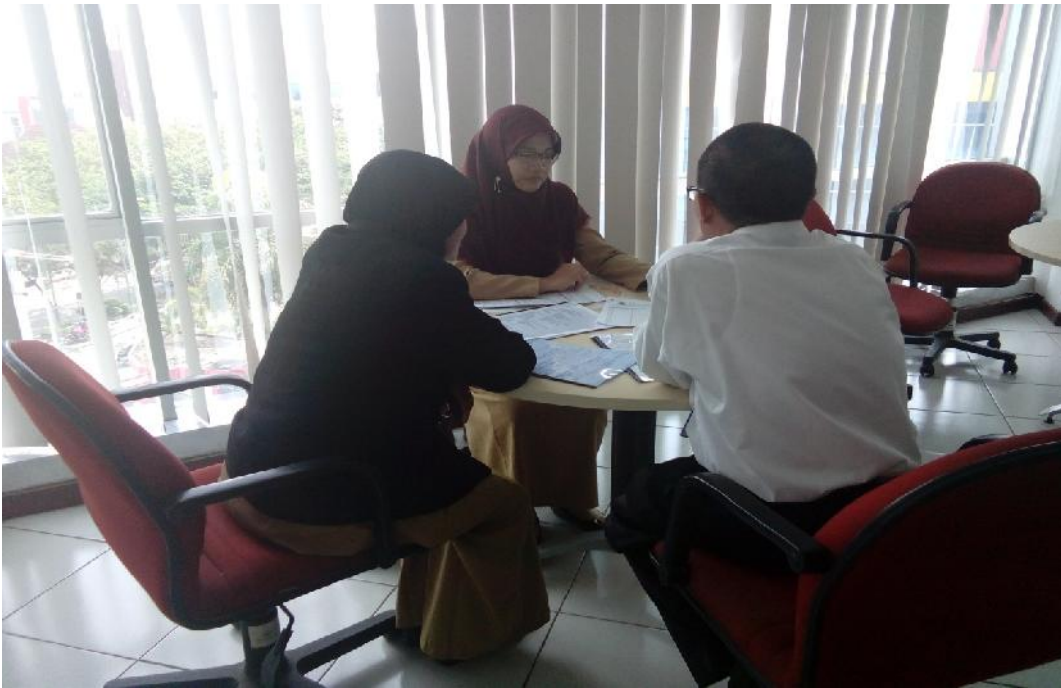
Konsultasi Wajib Pajak dengan petugas Account Representative