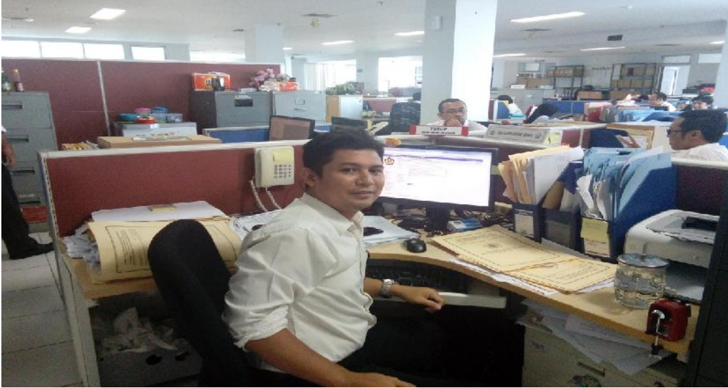
Foto Karyawan Account Representative