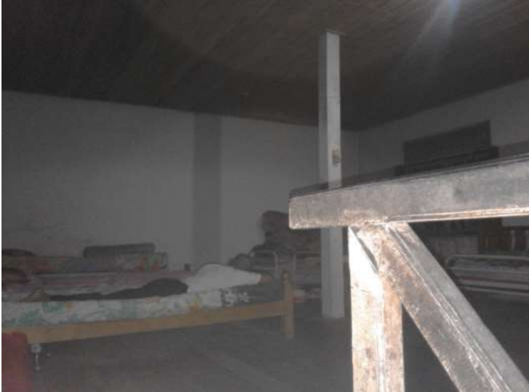
Ruang tempat kegiatan keagamaan