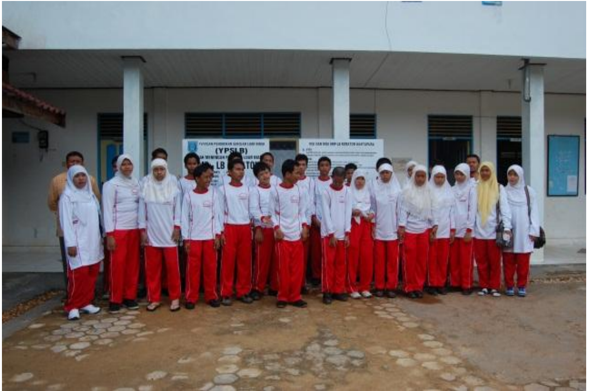
Foto siswa siswa SMPLB Keraton Martapura