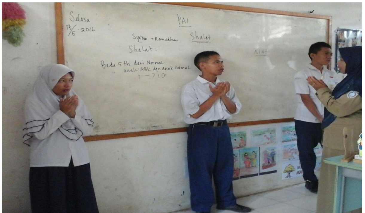
Foto anak saat pembelajaran dengan metode demonstrasi