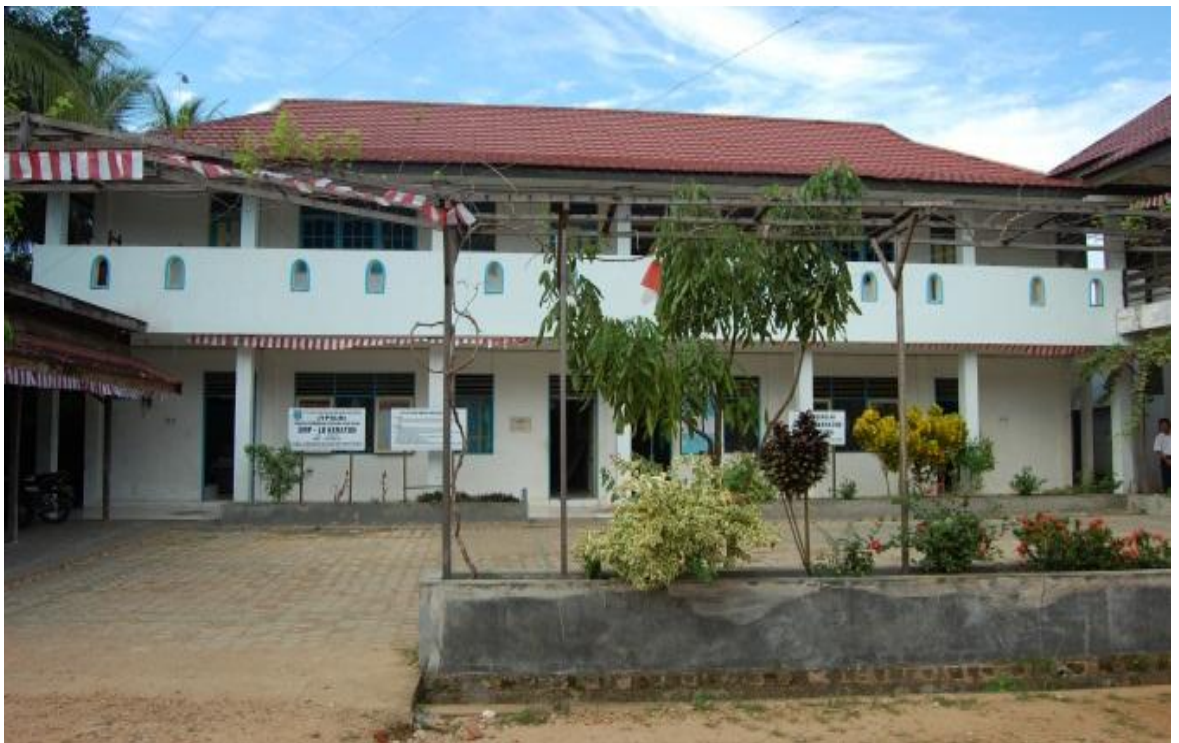
Profil SMPLB Keraton Martapura dari depan